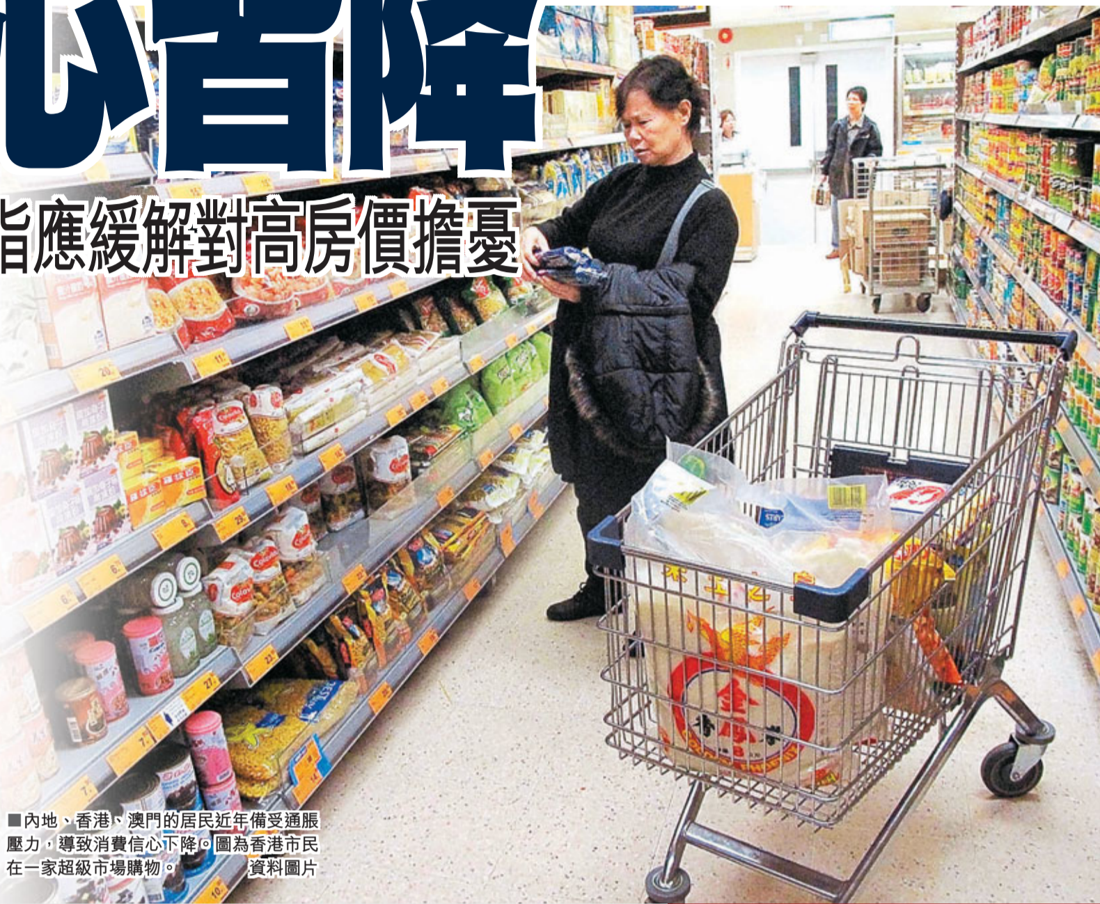
■內地、香港、澳門的居民近年備受通脹壓力,導致消費信心下降。圖為香港市民在一家超級市場購物。

此項調查由香港城市大學、澳門科技大學、台灣輔仁大學、首都經濟貿易大學、中央財經大學與中國人民大學共同完成。