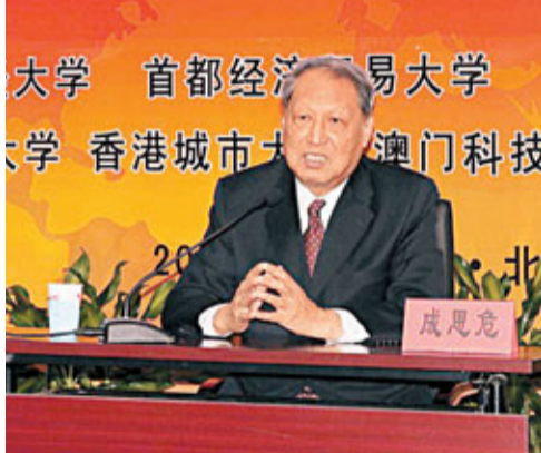
■原全國人大副委員長、著名經濟學家成思危。

香港文匯報訊(記者 趙一存、劉曉靜 北京報道)原全國人大副委員長成思危14日在「2010兩岸四地消費者信心指數年度發佈會」上回答香港文匯報記者提問時表示,上半年CPI或超6%,但下半年可能會回落,若全年能控制在5%為較理想狀態。