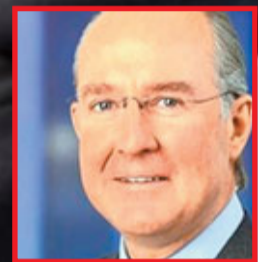
瑞銀亞洲區聯席行政總裁威爾莫特-西特韋爾。