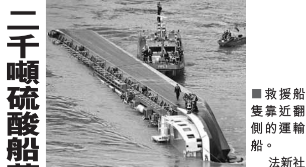
■救援船隻靠近翻側的運輸船。

每逢天災，總會傳出英雄故事，但亦總有人乘機「發國難財」。布里斯班一名網絡設計師4日前買下「www.brisbanefloods.com.au」(布里斯班洪水)域名，並將之公開拍賣，被政府及傳媒嚴厲抨擊，網絡設計師最終取消競投。 ■《悉尼先驅晨報》