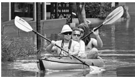
■小艇和獨木舟成為唯一的交通工具。

香港文匯報訊 澳洲城市布里斯班水災嚴重，有報道指，4名參加工作假期的港人被洪水圍困在屋內3天。本港入境處表示，已即時透過外交部駐港特派員公署以及中國駐布里斯班總領事館了解情況，至今獲獲4宗在布里斯班的港人求助，入境處已與當事人取得聯絡，確定他們身處安全地方。