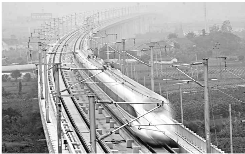
■近日,一列中國自主創新研製的新一代CRH380BL高速動車組,在京滬高速鐵路成功創造了每小時487.3公里的世界鐵路運行試驗最高速度。圖為京滬線上一列呼嘯而過高速動車組。

香港文匯報訊(記者 張帆 石家莊報導)近日,記者獲悉,由中國北車唐山軌道客車有限公司(簡稱唐車公司)自主創新研製的新一代CRH380BL高速動車組,在京滬高速鐵路先導段運行試驗中,成功創造了每小時487.3公里的世界鐵路運行試驗最高速度。據悉,該型號動車組已開始陸續交付用戶,這一車型將成為中國高速鐵路網的核心主力車型。