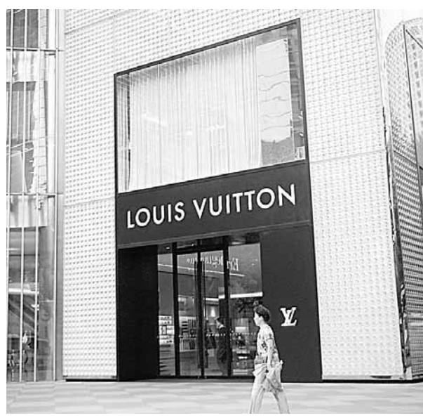
■LV在上海大舉擴張,也飽受侵權困擾。香港文匯報上海傳真

不過,受理此案的楊浦法院認為,市場管理者除了對商舖經營者售假的行為予以勸告外,還應當採取有效的