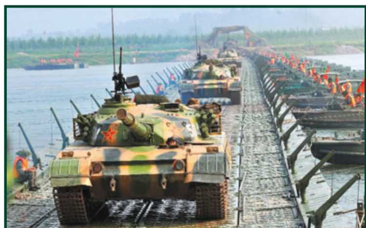
重型裝備快速通過浮橋。