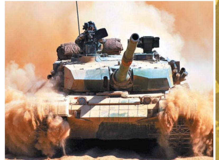
99式新型坦克沙場揚威。