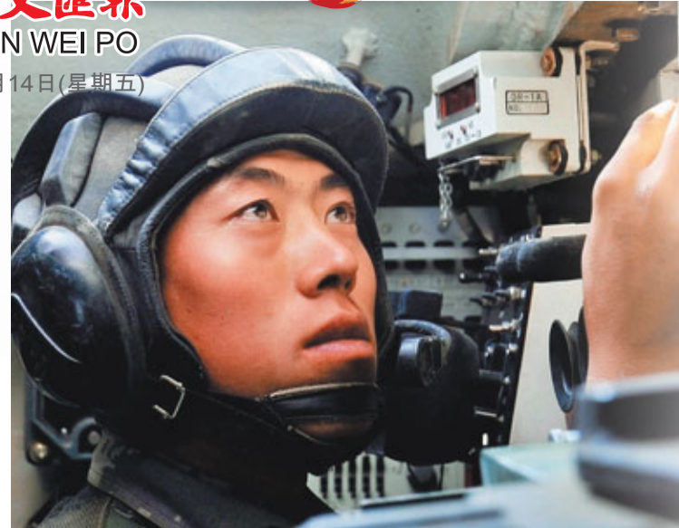
2010年9月，參加「和平使命-2010」上合組織成員國武裝力量聯合反恐軍事演習的坦克射手對目標進行精確瞄準。