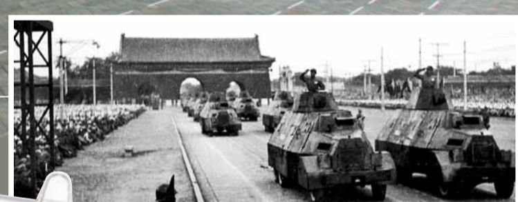
1949年10月1日，參加開國大典的裝甲部隊通過長安街。