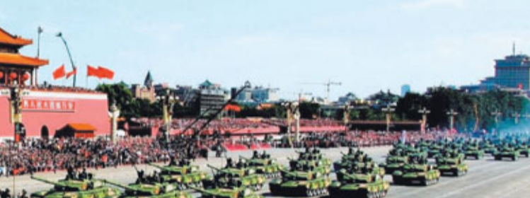
2009年10月1日，參加建國60周年大閱兵的99式坦克方隊率先通過天安門廣場接受檢閱。