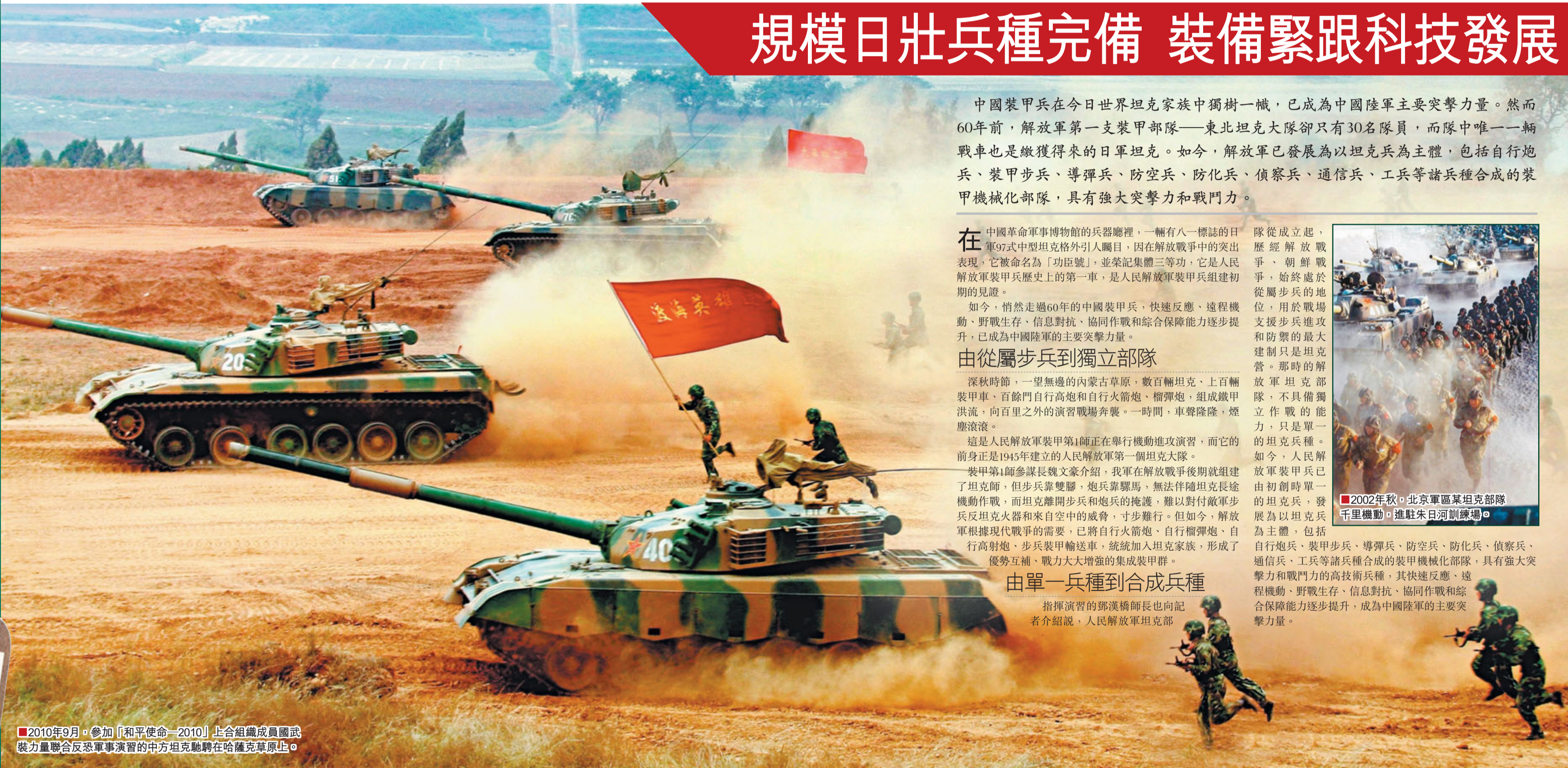
2010年9月，參加「和平使命-2010」上合組織成員國武裝力量聯合反恐軍事演習的中方坦克馳騁在哈薩克草原上。

中國裝甲兵在今日世界坦克家族中獨樹一幟，已成為中國陸軍主要突擊力量。然而60年前，解放軍第一支裝甲部隊——東北坦克大隊卻只有30名隊員，而隊中唯一一輛戰車也是繳獲得來的日軍坦克。如今，解放軍已發展為以坦克兵為主體，包括自行火炮、裝甲步兵、導彈兵、防空兵、防化兵、偵察兵、通信兵、工兵等諸兵種合成的裝甲機械化部隊，具有強大突擊力和戰鬥力。