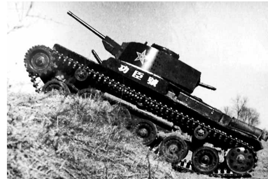
獨立戰功的「功臣號」坦克。