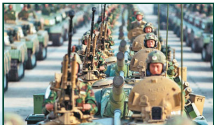
北京軍區某坦克部隊進行正規化訓練。