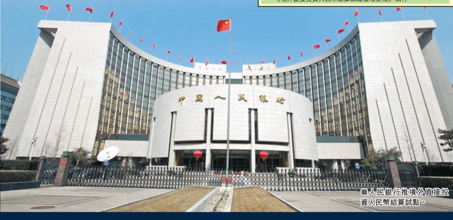
人民銀行推境外直接投資人民幣結算試點。

周小川指出,將在繼續推進資本項目可兌換的進程中,對現有的資本項目法規進行整合,逐步構建清晰明確的資本項目外匯管理法規體系。此外,央行還將強化跨境資金流動的統計監測和預警,防範跨境資本流動風險。