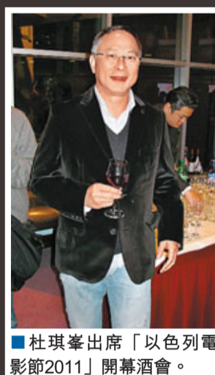
杜琪峯出席「以色列電影節2011」開幕酒會。

香港文匯報訊 (記者 李慶全)「以色列電影節2011」開幕酒會前晚於科學館舉行，由以色列駐港總領事安邁凱大使、商務及經濟發展局局長劉吳惠蘭擔任主禮嘉賓，杜琪峯及劉兆銘均出席支持。