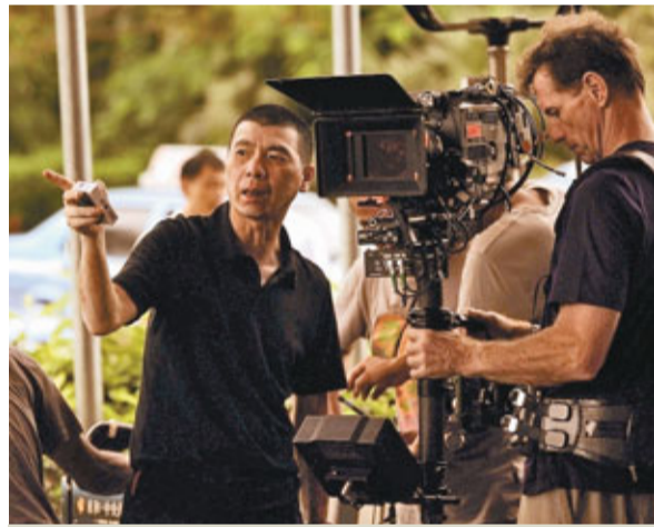
馮小剛影片叫座，說明觀眾對他的喜愛和認可。

香港文匯報訊 由華誼兄弟出品、馮小剛導演、王朔、馮小剛聯合編劇的賀歲電影《非誠勿擾2》於今日正式在香港上映。據悉，《非誠勿擾2》在內地票房元旦假期過後已經達到4.2億。