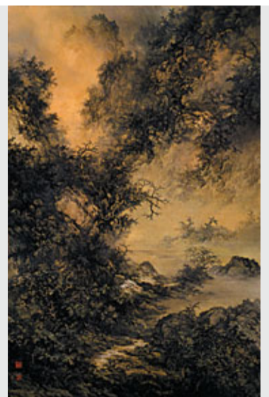
加藤良造的《山水境》