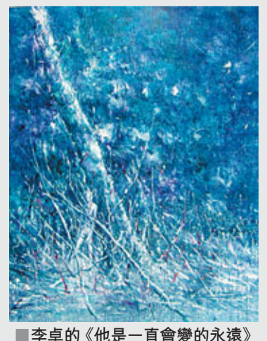
李卓的《他一直會變的永遠》