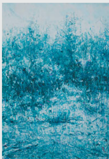
李卓的《找尋到的亦失去》