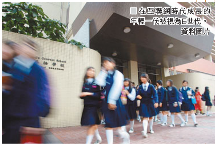
■ 在互聯網時代成長的年輕一代被視為E世代。 資料圖片