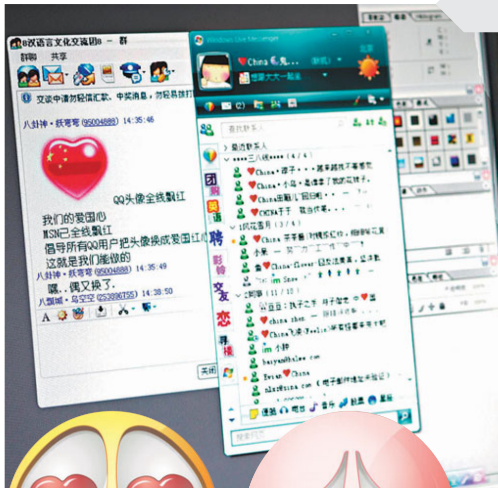
■ 調查顯示網絡友誼難以維持長久。