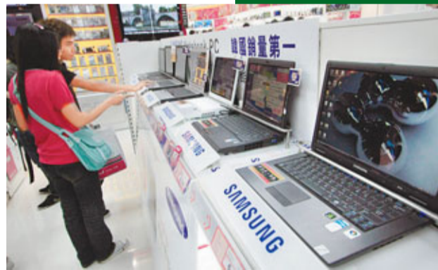
▼ 手提電腦是最受青少年歡迎的電子產品之一。 資料圖片

有心理學家說，青少年大多抱着隨意和純粹找尋傾談對象的心態來發展友誼，故網絡交友事實上是青少年自我表現的延伸。