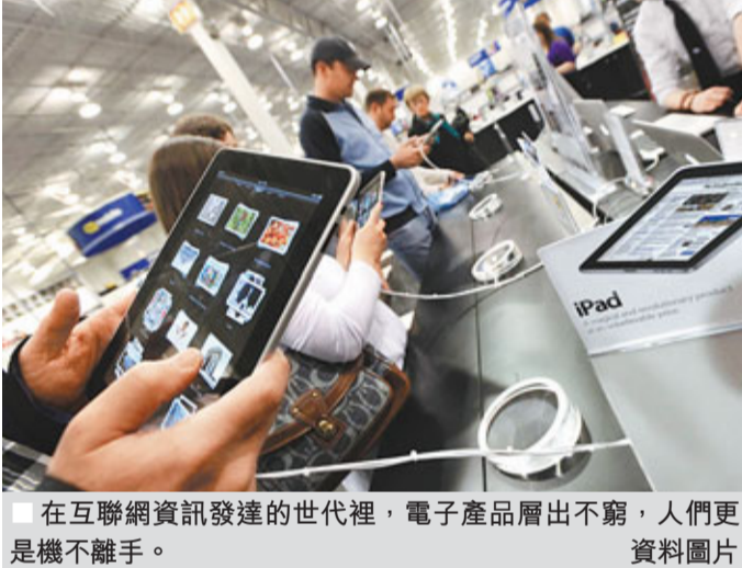
■ 在互聯網資訊發達的世代裡，電子產品層出不窮，人們更是機不離手。 資料圖片