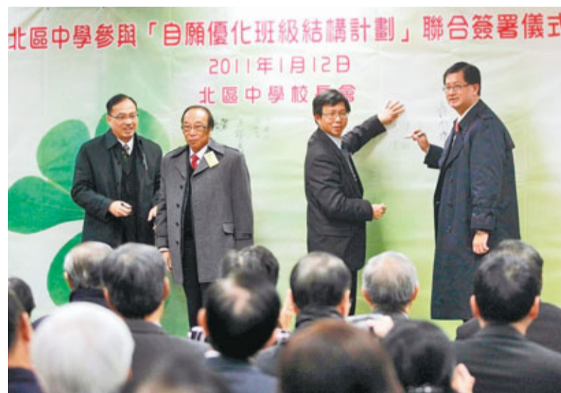
北區14所有開5班中一的學校昨日聯署參與減班，成為首個全區減班的區份。