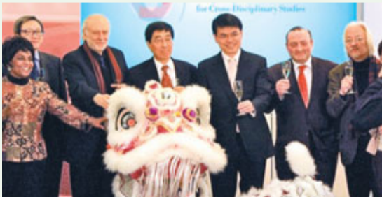
城大成立全港首間「香港跨學科高等研究院」，並以此成為周邊地區跨學科知識傳播中心為目標。圖為利大英(右二)、(右三)邱騰華和城大校長郭位(右四)與一眾嘉賓出席開幕禮。