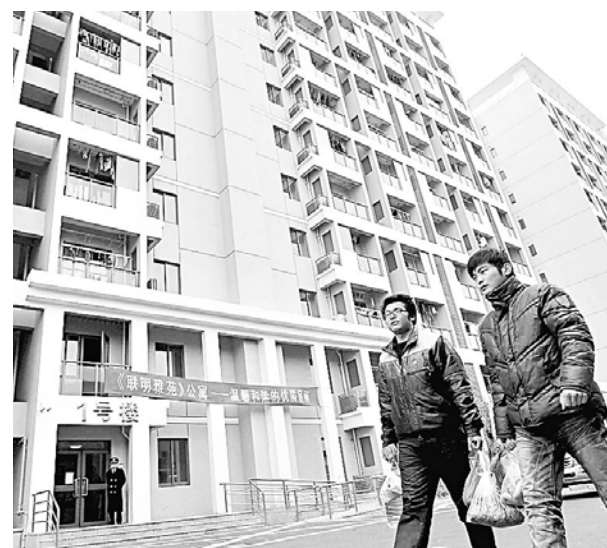
經上海市政府批准,農民集資9,300萬元建造公租房。圖為居民從出租公寓樓前走過。