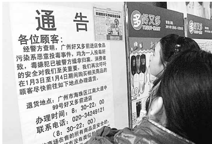
超市在門口貼出通告,市民議論紛紛。