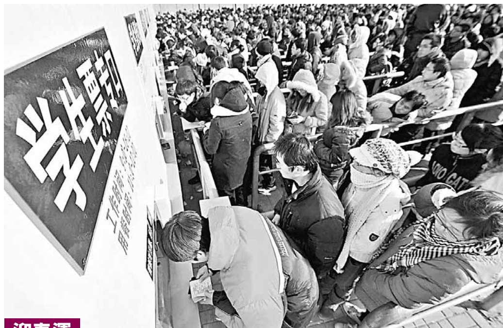
迎春運 天津站特別搭建的春運車票臨時預售處投入使用,15個售票窗口同時預售車票,緩解售票壓力。預計天津站在春運期間將運送旅客243萬人次,比去年同期增加22.2%。

為了應對今年春運出現的新情況與惡劣天氣的壓力,確保春運安全有序的開展,溫州市春運辦公室也提前做好了相關的工作安排。