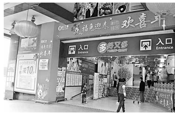
事發的好又多超市。

經衛生部門鑒定,涉嫌被投毒的大米和香菇含溴敵隆和氯敵鼠成分。據專家介紹,兩者均屬慢性殺鼠藥。中毒潛伏期3至10天,人不慎食入後出現腹痛、噁心、嘔吐、頭昏等不適,重者可出現鼻黏膜、牙齦出血,應用維生素K等治療,癒後良好,不會遺留後遺症。經污染的食品如食用前淘洗或清洗,毒性會大大降低。