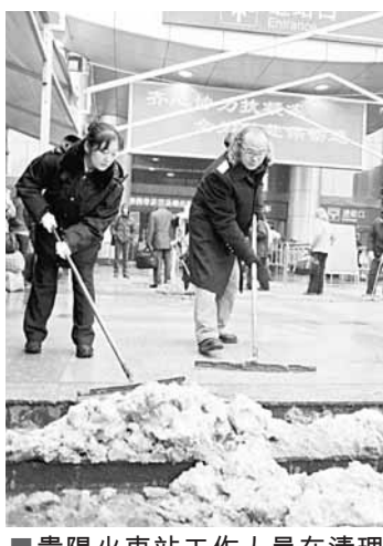
貴陽火車站工作人員在清理車站口的積雪。