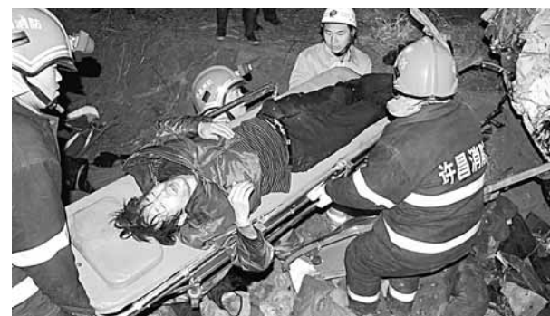
河南車禍16死 1月11日晚,河南平頂山運輸公司一客車在許平南高速公路發生一宗特大交通事故,造成16人死亡,23人受傷,其中6人傷勢嚴重。目前善後工作已展開,事故原因正在調查。初步認定,客車存超載問題。

文縣縣委宣傳部一位負責人對記者解釋說,部分災民房屋質量有問題確實存在,縣裡已經協調相關施工單位對居民做了補償。