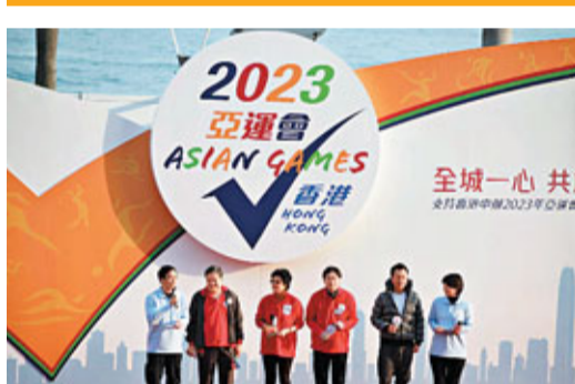
嘉賓出席「各界支持香港申辦2023年亞運」大型活動