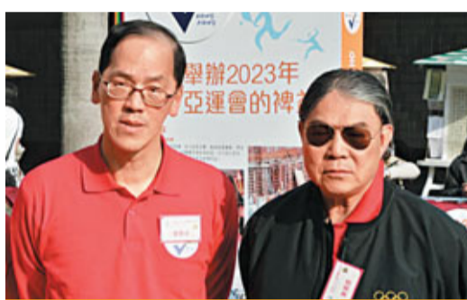
霍震霆與曾德成親臨現場支持申亞。

活動上，醫院管理局主席胡定旭，香港專業促進會副會長高永文，香港學界體育聯合會董事會主席劉新麗娟，酒店業主聯會總幹事李漢城，多名劍擊、單車、武術、空手道的運動健兒，影視明星黎耀祥上台輪流發言，從經濟、體育、文化、生活等不同角度分享申亞的好處。黎耀祥以《巾幗英雄》「劉醒」的名句「人生有幾多個十年」，呼籲香港不要錯過12年後的亞運會。