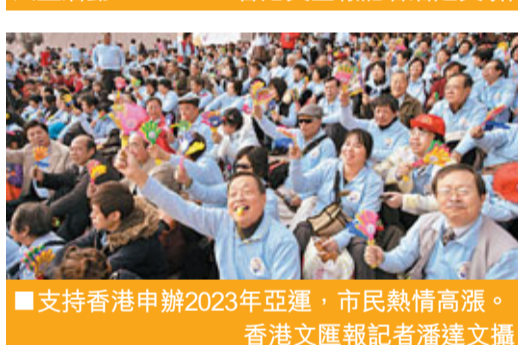
支持香港申辦2023年亞運，市民熱情高漲。