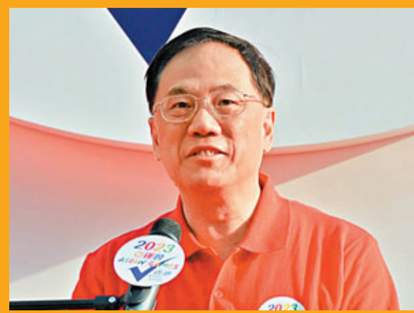
行政長官曾蔭權親臨現場支持香港申辦2023年亞運會