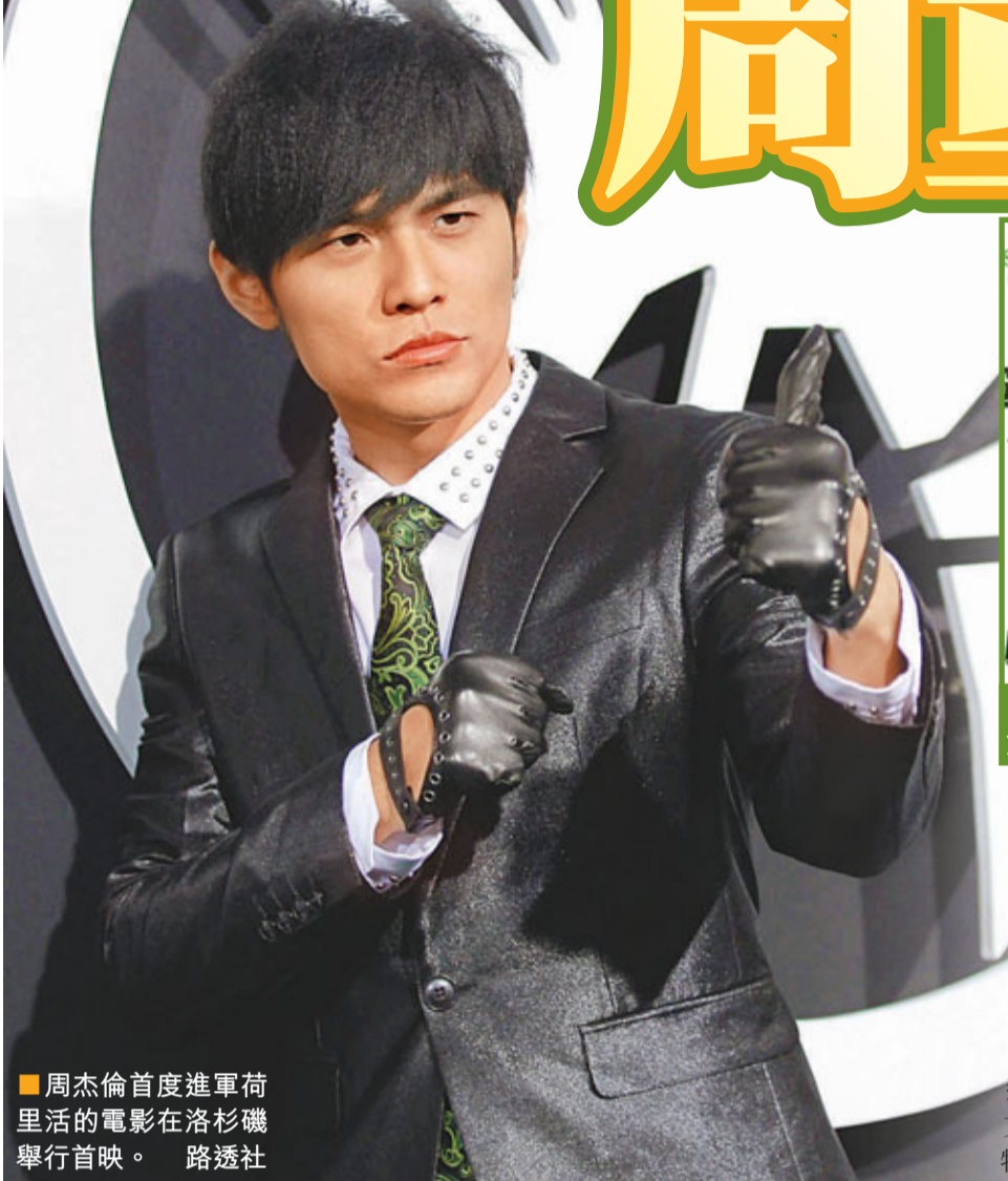
周杰倫首度進軍荷里活的電影在洛杉磯舉行首映。