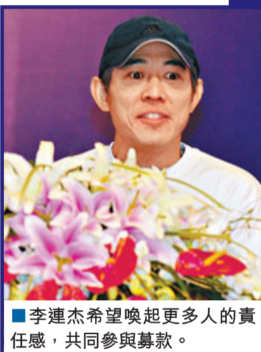
李連杰希望喚起更多人的責任感，共同參與募款。

現場有記者追問基金會第一年是否有募款目標，李連杰笑着回應說：「現在暫時沒有目標，也不會定目標要募多少錢。不是有錢能夠解決所有的問題，我們是希望喚起更多人的責任感，共同參與。」