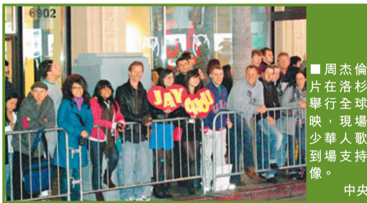
周杰倫新片在洛杉磯舉行全球首映，現場不少華人歌迷到場支持偶像。

周董也提到8日在洛杉磯舉行演唱會，女主角金美倫戴雅絲亦聯同電影團隊成員去聽演唱會，周杰倫說：「可惜金美倫戴雅絲太早離開，其實我很想讓她聽聽被選為《青蜂俠》片尾曲的《雙截棍》，因為這首很high，外國人雖然聽不懂，但相信他們會喜歡這個節奏。」金美倫戴雅絲接受訪問時對周杰倫的表演大為激賞，讓她留下深刻印象，也表示周杰倫的演唱會相當精彩，他是個很多才多藝的藝人，既會彈吉他，又能唱歌，還能跳舞，真的是很棒。