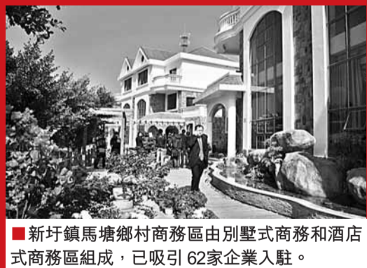
■新圩鎮馬塘鄉村商務區由別墅式商務和酒店式商務區組成,已吸引62家企業入駐。

變身新城鎮,兩鎮邁開了堅實的步伐。香港文匯報記者獲悉,迄今為止,廈門市兩個試點鎮共92個項目已被列入建設計劃,總投資約25.5億元。截止至2010年11月10日,兩鎮已開工建設項目31個,完成投資約13.85億元,完成年投資計劃的94%,排名福建第一。