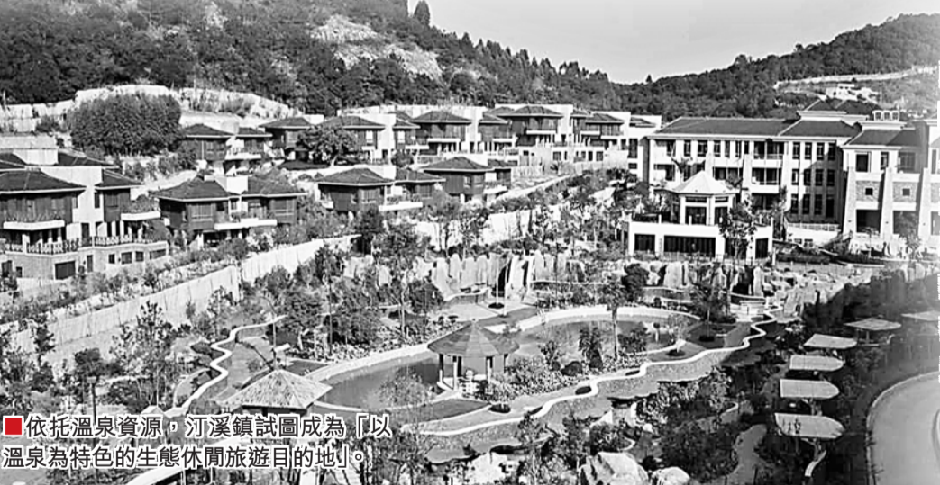
■依托溫泉資源,汀溪鎮試點成為「以溫泉為特色的生態休閒旅遊目的地」。

鄉村變身城市綜合體,福建21個綜合改革建設試點小鎮鎮正如火如荼打造「變形計」。廈門兩大試點鎮各有法寶,為中國小鎮的改革提供了參考樣本。其中同安區汀溪鎮以傳統的農耕文明為起點,主打鄉村旅遊和溫泉度假,將直接晉陞生態旅遊村。翔安區新圩鎮則依托已有的強勢工業銀鷺和利勝光電,將升級為生態宜居的創業新城。