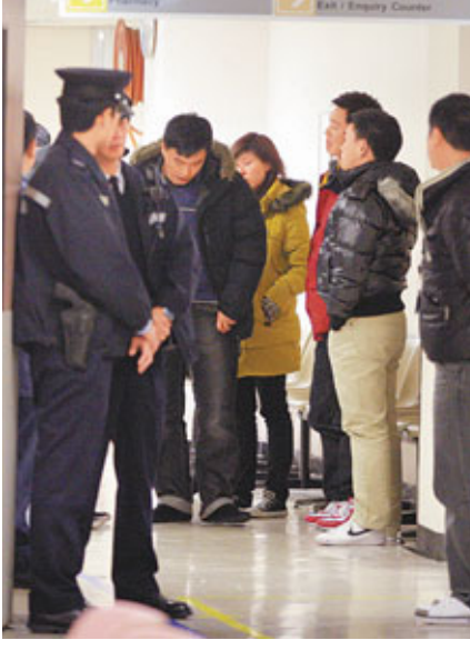
▲多名同袍趕到醫院了解情況，神情凝重。