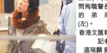
▲警察福利主任(中)慰問殉職警長的弟(左)。