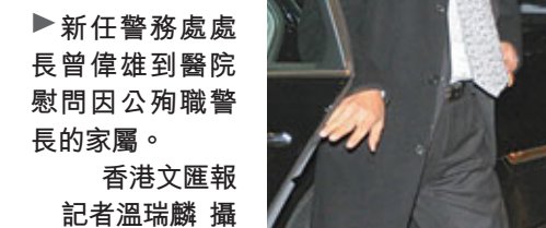
▲新任警務處處長曾偉雄到醫院慰問因殉職警長的家屬。