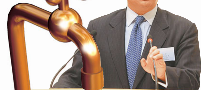
■李小加指出,港交所正研究成立人民幣資金池。資料圖片

對於李小加料今年港交所將會出現首隻人民幣計價股票或IPO,他回應查詢時不想評論是否已收到申請,只表示,房地產信託基金(REIT)的確較人民幣股票更易推行,主要由於REIT屬於定息產品,對人民幣流通量的依賴較少。但他表示,各方已基本做好以人民幣計價的股票產品的準備工作,股票發行人興趣極大,本港相關的監管架構能支持上市及交易,證券市場基礎設施大部分已準備就緒,包括券商在內的仲介機構也即將完成準備工作。