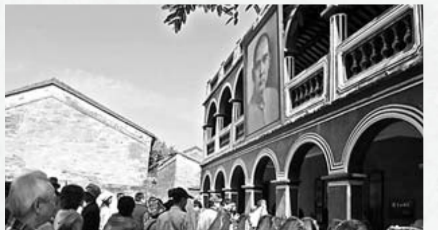
■2010年11月12日孫中山誕辰144周年，各界人士來到位於中山市翠亨村的孫中山故居參觀。 資料圖片

孫中山的思想滲透在中山經濟社會和人文理念之中。首先，孫中山先生「敢為天下先」的精神深深鼓舞了中山，中山人在改革開放後，很早時候就主動去外面學習先進技術和管理經驗，創造了很多個第一，以佔全省1%的土地面積、2.7%的人口，創造了佔全省3.8%的生產總值，經濟總量位居全省21個地級以上的第5位，並獲首批全國文明城市殊榮。其次，中山市的宜居城市的建設、走和諧發展之路，也得益於孫中山先生的「社會和經濟協調發展」的思想。再者，現在孫中山先生的天下為公、博愛精神在中山市已經家喻戶曉，並深