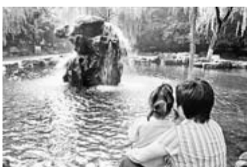
■曾經噴湧的月牙泉

的山石頂部已不見噴湧的泉水，受低溫天氣影響，只見泉眼處幾根長長的「冰柱子」從高高的山石上垂下，令觀泉遊客駐足歎息。據了解，濟南月牙泉由於地下水位過低曾多次停噴。去年8月21日，沉睡兩年的月牙泉於趵突泉地下水水位突破29米大關時「甦醒」恢復噴湧，連續4個月再現「月牙飛瀑」勝景。