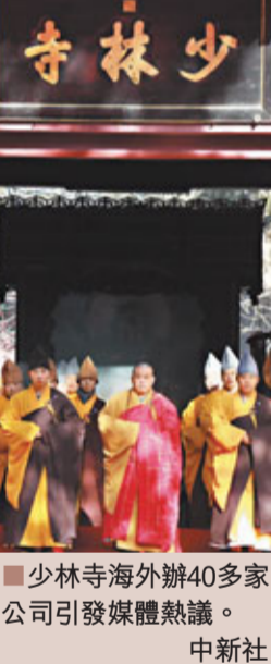
■少林寺海外辦40多家公司引發媒體熱議。 中新社

記者10日登陸少林寺官網看到，一篇題為《媒體報道所謂「少林寺海外40家公司」的謠言與誤導》的書面回應稱，釋永信方丈曾表示在世界許多國家開辦了「少林文化中心」，而非媒體報道所指的「40家海外公司」。 ■中新社