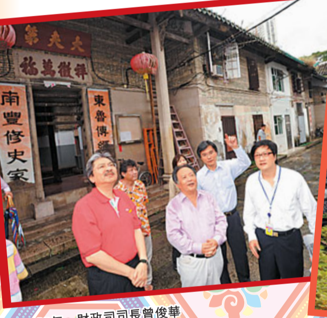
2009年,財政司司長曾俊華參觀曾大屋。