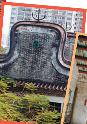
曾大屋四角建有鑊耳形砲樓