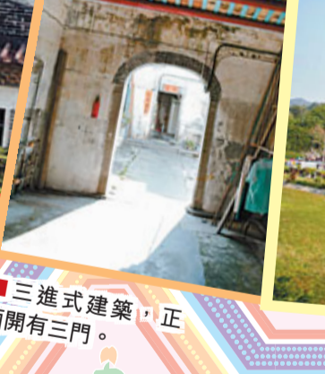
三進式建築,正面開有三門。