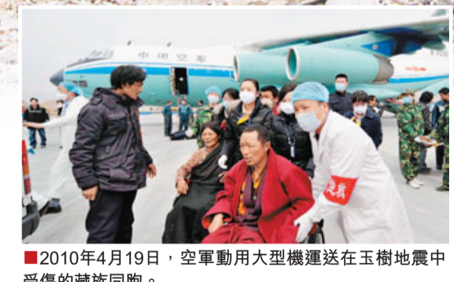
2010年4月19日，空軍動用大型機運送在玉樹地震中受傷的藏族同胞。