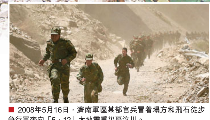
2008年5月16日，濟南軍區某部官兵冒雪場地和飛石徒步急行軍奔向「5·12」大地震重災區汶川。