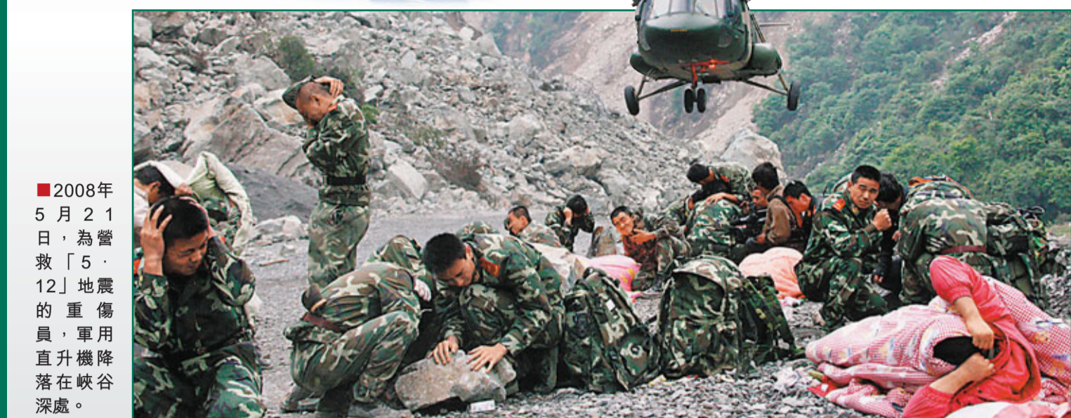
2008年5月21日，為「5·12」地震的重傷員，軍用直升機降落在峽谷深處。