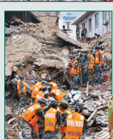
2010年9月10日，解放軍某部在舟曲泥石流災區中搶險。