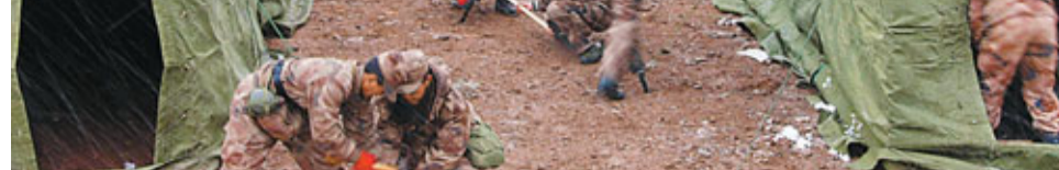
2010年4月22日，在玉樹抗震救災中，解放軍官兵頂風冒雪為孩子們搭建帳篷，早日復課。