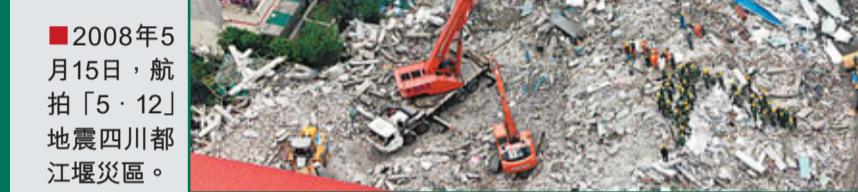
2008年5月15日，航拍「5·12」地震四川都江堰災區。