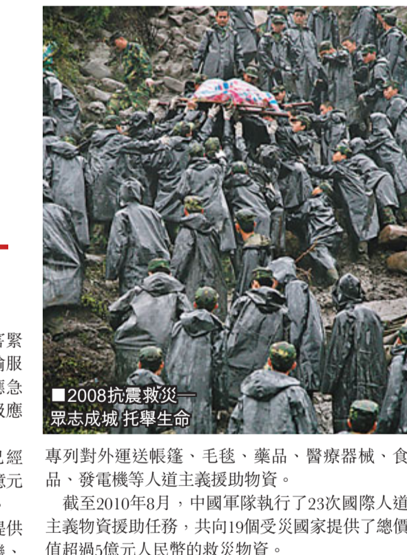
2008抗震救災一眾志成城托舉生命。

對於中國軍隊在近期重大災難救援中的出色表現，國防大學教授金一南認為，這是國力和軍力同時提升的結果。98年抗洪，後勤補給一時無法跟上，部隊只能依靠地方，行動和效率大受影響。而08年以來的一系列救災行動，軍隊強有力的現代化後勤裝備，不但為十幾萬官兵提供了保障，還解決了災區民生的生活急需。「從這一點可以看出，10年來軍隊建設發生了巨大變化。」金一南說，「富國強兵是一個統一體，沒有國力的發展，強兵永遠只是夢想。」