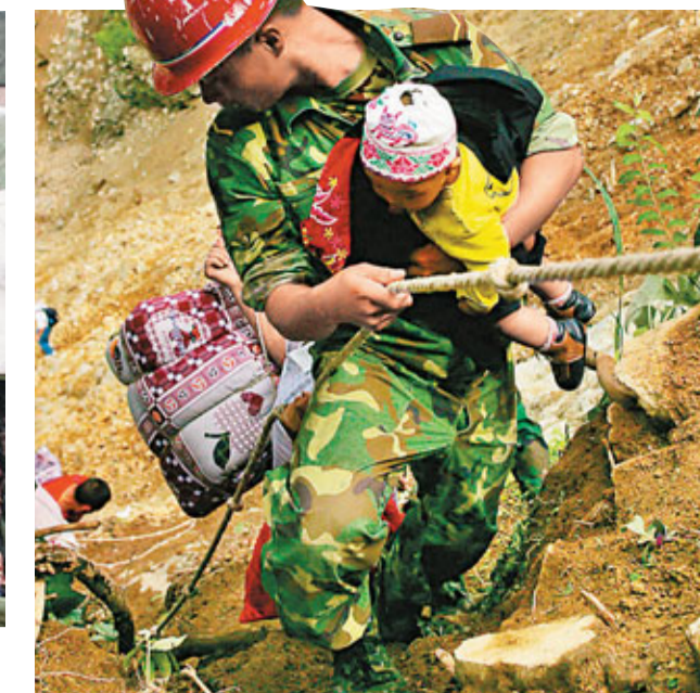
一名解放軍戰士揹運受災兒童。

除了硝煙瀰漫的戰場，他們的身影出現在人民最需要的地方：汶川、玉樹、舟曲……哪裡有他們，哪裡就不再絕望。其中，僅汶川一役，中國軍隊就出動14萬人，搜救被掩埋群眾2.7萬人。老百姓說：解放軍來了，我們就有救了！