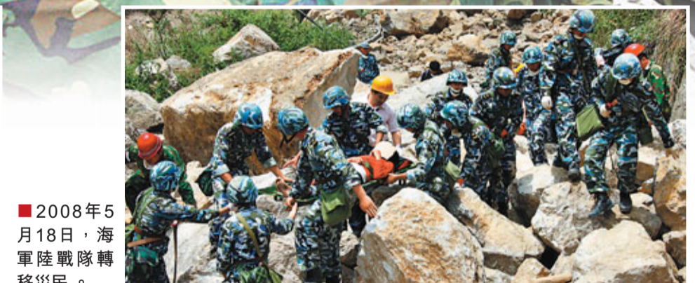
2008年5月18日，海軍陸戰隊轉移災民。