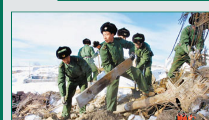
2010年昭蘇地震解放軍出兵救援。