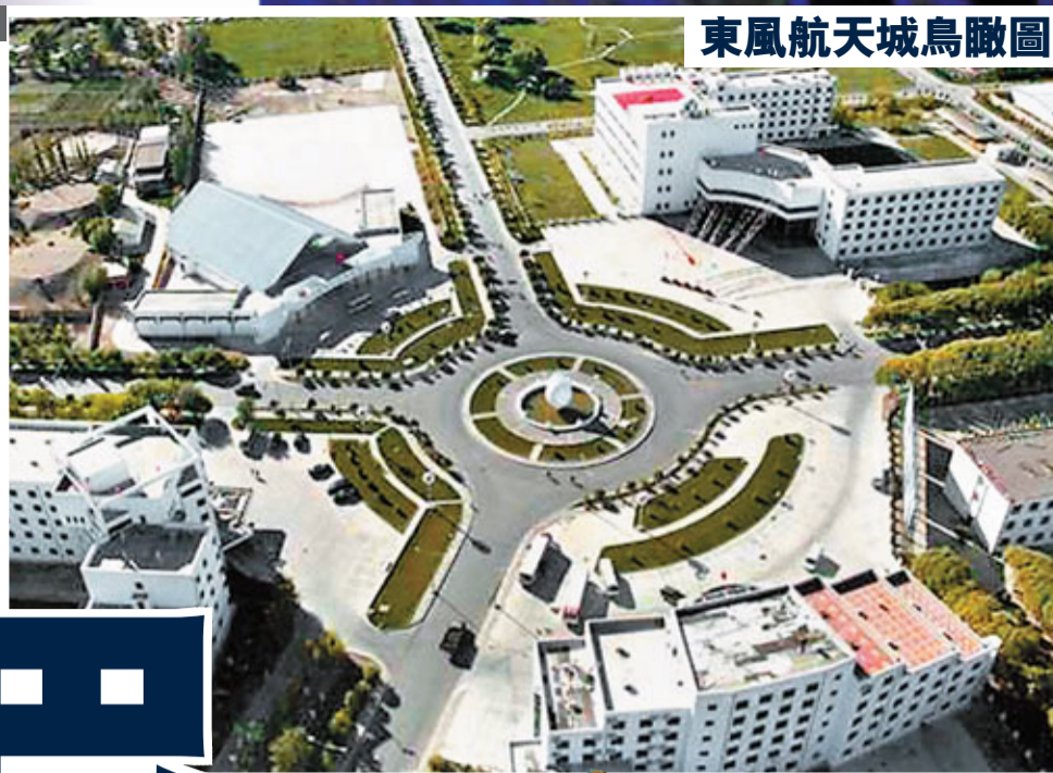
東風航天城鳥瞰圖

和航天事業600多名英傑長眠於此，轟帥的部分骨灰也安放此間。點點墳塋裡有「九人墓」、「夫妻墓」，還有無字碑。這些英烈中，有500多人平均年齡只有24歲！寶日烏拉的基地建碑銘文，記錄下一個民族艱難奮起的側影…… 高聳的發射架、航天紀念館、航天員公寓……都是令人留連忘返的地方。問天閣留下了航天員的珍藏紀念，楊利偉及費俊龍、聶海勝出征前都在他們居住的房門後簽名留言。由前國防部長張愛萍上將題寫館名的陳列館櫺窗裡，陳列着創業者們留下的工具及許多的圖片資料，還有「神舟」宇宙飛船發射過程的模擬演示。