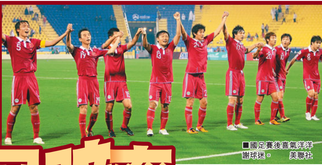
國足賽後喜氣洋洋謝球迷。

香港文匯報訊 (記者 陳曉莉) 中國國家男子足球隊(國足)香港時間8日晚在亞洲盃A組首場比賽中以2:0擊敗新科海灣盃冠軍科威特後，無論是奪冠賠率還是小組出線，呼聲都開始「升溫」。其中，奪冠賠率由賽前的1賠15位居第七上升到1賠12位居第五；而小組出線方面，中國與烏茲別克都成為A組大熱。不過，日本、韓國、澳洲仍是冠軍的熱門球隊。