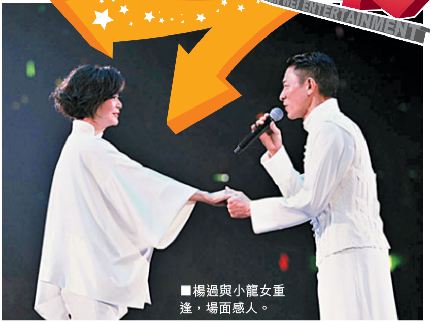
楊過與小龍女重逢，場面感人。

香港文匯報訊 《劉德華Unforgettable演唱會》前晚於一片吶喊聲中圓滿結束，華仔竭力演出，務求令歌迷盡興而歸。演唱會亦吸引多位圈中好友出席捧場，包括有鍾楚紅、陳伶俐和新歡、方逸華帶同三位愛將陳志雲、李寶安、樂易玲等前來捧場。