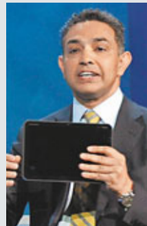
在剛結束的美國拉斯維加斯國際消費電子產品展(CES)上，摩托羅拉可謂獨領風騷，該公司推出的平板電腦「Xoom」(左圖)和智能手機「Atrix」(右圖)，分別獲選為全場最佳電子產品和最佳智能手機，兩者均是使用Google的Android操作系統。