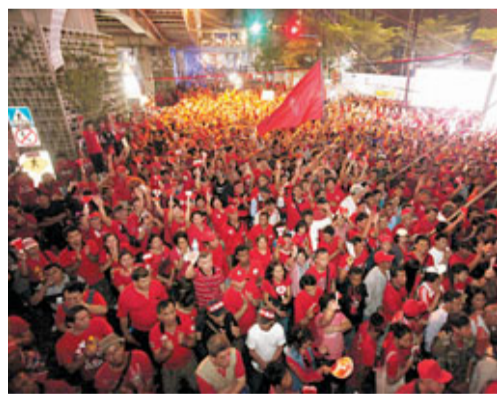
泰國約3萬名反政府紅衫軍昨日在首都曼谷集會(見圖)，要求釋放在囚領袖，並哀悼去年在軍警武力鎮壓中喪生的成員。當局出動1,000名軍警戒備，期間發生短暫衝突，但示威大致和平。紅衫軍領袖表示已汲取教訓，改變集會策略。

今次是去年5月軍警血腥鎮壓以來，紅衫軍最大規模的一次集會，也是總理阿披實政府上月22日撤銷曼谷緊急狀態後，紅衫軍發起的首場示威活動。