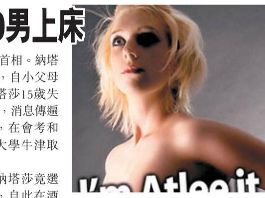
艾德禮是英國二戰後首任首相，曾被選為20世紀英國最佳首相。納塔莎是艾德禮的「玄孫孫」，自小父母離異，由祖母照顧。納塔莎15歲失身，初夜更是3人性交(3P)，消息傳遍校內。她其後壓抑性慾，在會考和高考取得佳績，獲名牌大學牛津取錄。

英國前工黨首相艾德禮(左圖)的24歲女兒艾德禮(右圖)，公然自認性上癮，號稱曾與超過500名男性上床。生於軍事世家的她，聲稱在4年內藉舉辦濫交派對，賺了45萬英鎊(約544萬港元)，參加者包括高等法院法官、國會議員、律師和警察等。