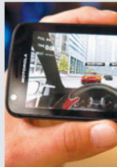
Xoom同時獲選為CES會場最佳平板電腦，它採用專為平板電腦設計的最新Android Honeycomb操作系統，並配備10.1吋屏幕，大小與蘋果iPad相若。Xoom將於4月面市，預料將成為iPad的一大對手。摩托羅拉首部4G手機Atrix獲得外界一致好評，能夠化身成電腦的前衛功能更備受讚賞。其他產品方面，任天堂最新3DS獲選為最佳遊戲機，索尼HandyCam攝錄機則獲選為最佳數碼攝影產品。

CES上，一家科羅拉多州參展商展出名為Sphero的發光機械球，它的賣點是內置迴旋儀和加速器，能夠利用蘋果iPhone或Android智能手機，透過藍芽技術控制在地上滾動。設計簡單但有趣，令Sphero成為全場焦點，兼入圍最佳產品之一。這個手掌大小的機械球預計年底在美國發售，定價為100美元(約777港元)之下。