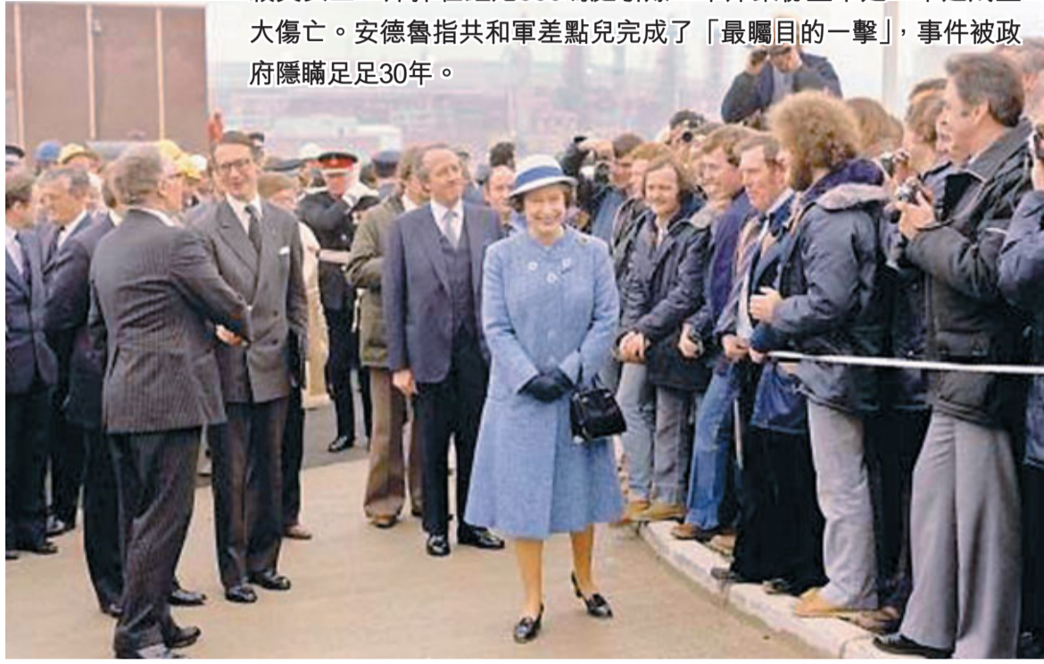
1981年英女王在蘇格蘭的設得蘭群島主持油庫開幕儀式。據稱當時她險遭刺殺。