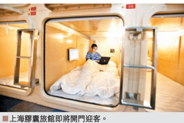
上海膠囊旅館即將開門迎客。

在中山北路1036號一個不起眼的門面，記者找到了這個新鮮事物。鋼框架的「膠囊」，寬和高約110厘米，長220厘米，有枕頭被子、通風扇、可調燈光、鬧鐘、電源插座、液晶電視，還能上網遊覽。68個格子間分成A、B、C三區，此外還有浴室、衛生間、吸煙區、小賣部和存物區。據了解，膠囊旅館的材料技術要求很高，從框架到配件均為防火耐火材料，連「床墊都是拿去做防火檢驗的」。