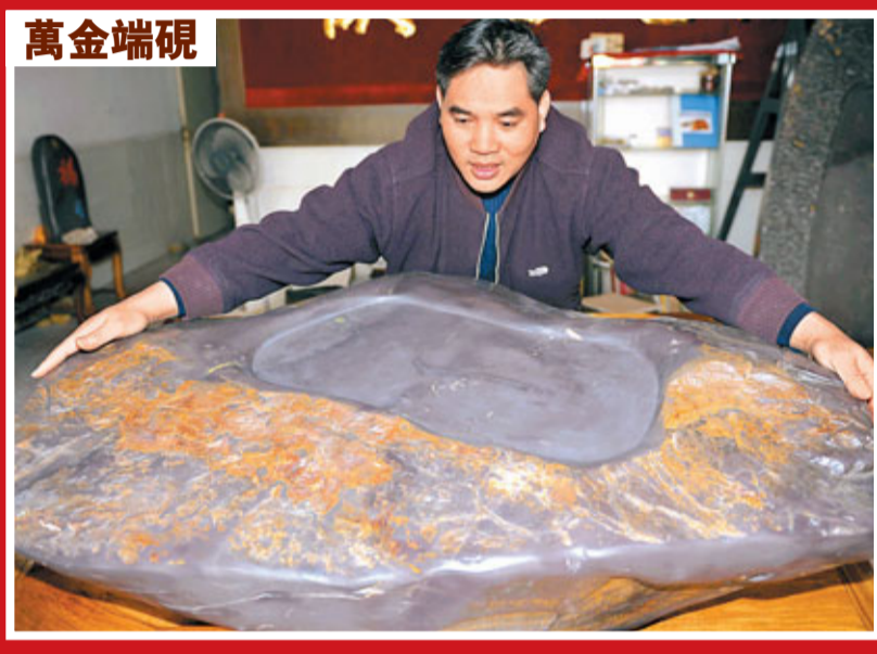
廣東肇慶驚現稀有巨型坑仔岩舊料端硯，其重量300多公斤，長112cm、寬70cm、厚23cm，雲集了坑仔岩所具有的魚腦碎凍、蕉葉白、浮絨、火捺、胭脂、暈、玫瑰紫、石眼、天然石皮等名貴石品花紋，整塊石料價值超過200萬元。