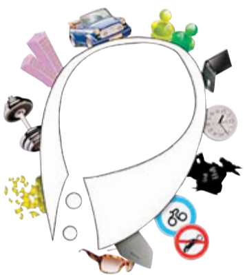
「新白領標準」對生活舒適度等方面亦有諸多要求，但第一條月薪指標就只有6%的人符合。網上圖片

香港文匯報訊（記者 周逸 上海報導）一份最新的「白領標準」近日瘋傳網絡，這份標準指，「白領」這個概念亦需與時俱進，不僅從經濟收入上要有跨越式「進步」，生活舒適度等方面亦該有更高的要求，因此誕生「新白領」。但許多上班族看到第一條「月入2萬以上」便已「出局」。