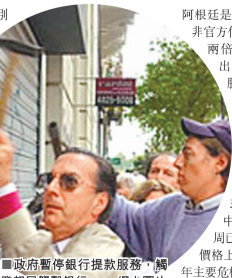
政府暫停銀行提款服務，觸發民眾襲擊銀行。

中央銀行前天表示，計劃啟動特殊措施，確保銀行現金供應。央行官員稱，由於該國鑄幣局印刷紙幣能力有限，央行已委託巴西的印鈔廠，緊急印刷總值100億比索(約195億港元)的100元紙幣，一半已投放到流通領域，另一半將在今後幾天陸續運到阿根廷。內閣首長費爾南德斯表示，相信問題可於本周末解決。