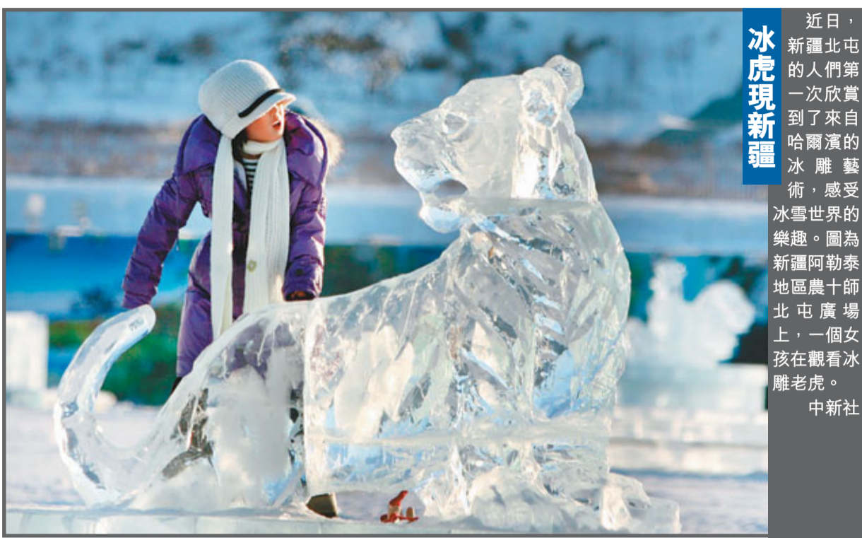
近日，新疆北屯的人們第一次欣賞到了來自哈爾濱的冰雕藝術，感受冰雪世界的樂趣。圖為新疆阿勒泰地區農十師北屯廣場上，一個女孩在觀看冰雕老虎。

一家水果店老闆向記者表示，他去果批市場批發水果也是要連着紙箱一起稱的，每次批發回來一稱，紙箱都要割去幾斤，他們也很無奈，最後相當於還是消費者買了單。一個廢品回收站的老闆透露說，裝水果的紙箱基本都灌了水泥。記者又以水果批發商身份電話諮詢一家紙箱廠，表示想買灌水泥的加重紙箱，工作人員稱現在水泥漲價了，灌裝水泥不划算，他們有充膠的紙箱，比水泥紙箱輕點，但價錢便宜。一個蘋果收購商告訴記者，果農提高了收購價格，收購商再漲價，下級批發商接受不了，生意不好做，只能在包裝上動手腳。