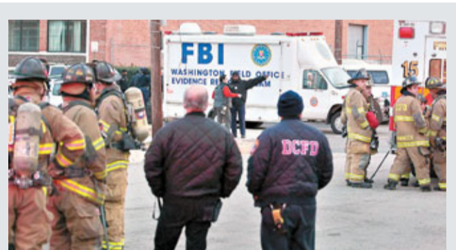
在首都華盛頓，FBI和消防員到郵局調查。