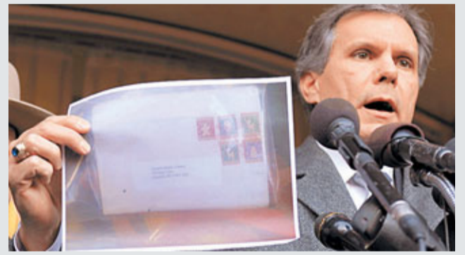
馬里蘭警方發言人展示起火郵包的圖片。

美國馬里蘭州和首都華盛頓於周四和周五，先後發生3宗郵包自燃事件，造成兩人輕傷，3名收件人全是政府官員，其中一人據報是國土安全部長納波利塔諾(右圖)。當局擔心將有更多自燃郵包出現，聯邦調查局(FBI)與警方展開調查。據報，在馬里蘭州的一個包裹中有張字條，對當局設立的反恐熱線表達強烈不滿。