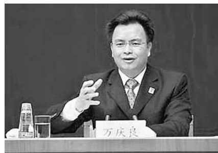
廣州市市長萬慶良以自己為例談住房觀念轉變，引發網友大討論。

香港文匯報訊(記者 古寧 廣州報道)在6日舉行的中共廣東省委十屆八次全會相關討論會上，廣州市市長萬慶良針對有關房價高企問題稱，自己沒買房，住130多平方米公寓，每月交租600元。此語引起熱議，有博友說萬市長說了實話，表達意思也有一定道理。但也有網友報料指，市長所住公寓目前均價3.5萬元，網上一套118平米的要租金8,200元。