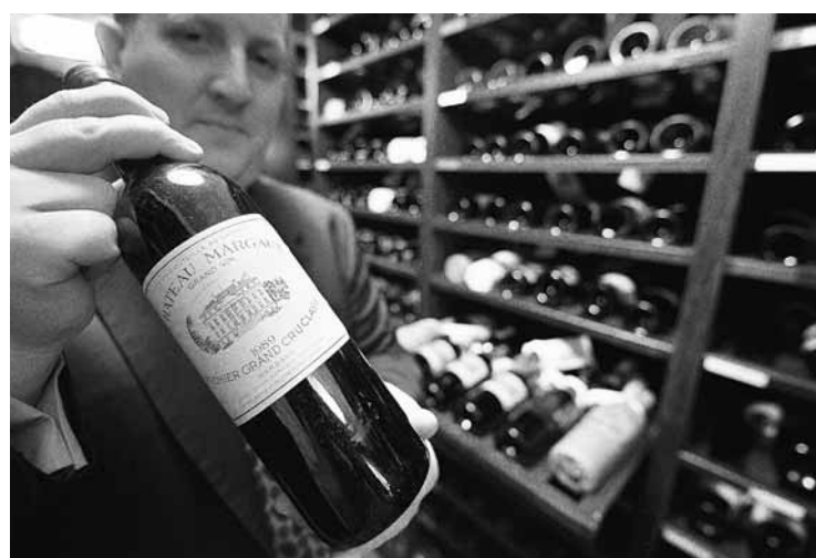
香港和內地每年共吸納3,350萬支葡萄酒，僅比德國這個傳統市場少50萬支。多期貨所得盈利。梅多克認為，內地市場仍未現冷卻跡象。

法國酒區波爾多葡萄酒協會公布，去年出口到香港和中國內地的總值達3.33億歐元(約33.6億港元)，成波爾多酒第一出口市場。酒商正發掘內地二線城市潛力，而香港自2008年撤銷葡萄酒入口稅後，積極與法國酒區合作，在開拓內地市場上扮演重要角色。外界相信，內地和香港有機會在出口量上超越德國這傳統市場。