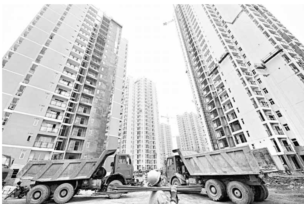
重慶公共租賃房鴛鴦片區「民心佳園」一角，2011年重慶市將開工新建1,300萬平方米公租房。

目前，上海、南昌、陝西、河南、西安等地已相繼公佈2011年加快保障房建設的計劃與措施。