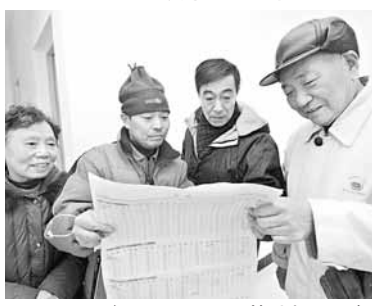
2011年1月5日，杭州620套「公租房」首次面向「夾心層」公開選房。

香港文匯報訊(記者 王曉雪 北京報道)日前，權威部門公佈2011年全國保障房建設目標大幅提高到1,000萬套，遠遠超過去年的590萬套，創下歷年之最。住房和城鄉建設部將於近期與各省級政府簽訂「軍令狀」，任務完成情況將納入對地方政府的考核。