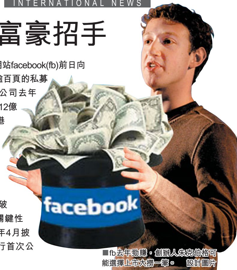
■fb去年勁賺，創辦人索克伯格可能選擇上市大撈一筆。設計圖片

全球最大社交網站facebook(fb)前日向潛在投資者分發逾百頁的私募備忘錄，披露該公司去年頭9個月營收高達12億美元(約93.3億港元)，盈利3.55億美元(約27.6億港元)，淨邊際利潤率近30%，遠勝市場預期。該公司有意在今年突破500個股東這一關鍵性限制，最快於明年4月披露財務資料或進行首次公開招股(IPO)。