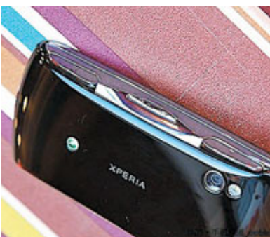
■據網站指，這台PS Phone搭載前後攝像鏡頭。

雖然在拉斯維加斯國際消費電子產品展(CES)，索尼未公布備受期待的結合PlayStation遊戲功能手機，但昨日在內地科技網站「IT168」上，卻出現一部聲稱是PS Phone(暫名)的手提電話，並提供詳細評測，消息引起不少海外科技網站關注。