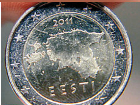
■愛沙尼亞地圖的東部踩過俄國領土。