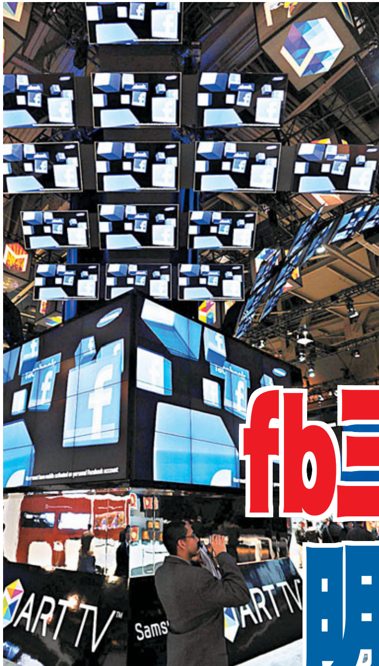
■在國際消費電子產品展覽裡，三星電視正顯示facebook的標誌。

全球最大社交網站facebook(fb)前日向潛在投資者分發逾百頁的私募備忘錄，披露該公司去年頭9個月營收高達12億美元(約93.3億港元)，盈利3.55億美元(約27.6億港元)，淨邊際利潤率近30%，遠勝市場預期。該公司有意在今年突破500個股東這一關鍵性限制，最快於明年4月披露財務資料或進行首次公開招股(IPO)。