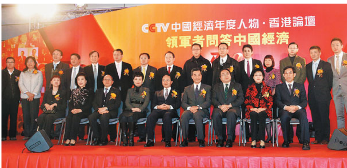
第11屆「中國經濟年度人物」論壇昨首次移師香港舉行。

曾被評為「年度大人物」的新浪首席執行官兼總裁曹國偉預料，互聯網將會是中國未來經濟發展的新亮