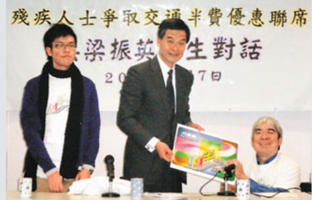
梁振英與殘疾人士討論爭取交通優惠。

不過，有疑為「挺陶派」的網民留言反擊，「睇咗咁多回覆，其實大家都係維護同一樣嘢：未審先判，「咩都係陰謀論，個個捕風捉影……會唔會個個都神經衰弱」。看來，社民連新一輪大戰已經一觸即發。