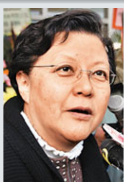
范徐麗泰

香港文匯報訊(記者 鄭治祖、聶曉輝) 就香港「支聯會」及民主黨等反對派要求容許包括王丹等所謂「民運人士」來港，出席已故「支聯會」主席司徒華的喪禮，而有關人士亦「承諾」在港期間會保持低調，包括不接傳媒訪問。全國人大常委范徐麗泰不點名指，過往亦有所謂「民運人士」聲言不作公開發言，但在獲准來港後並沒有信守承諾，令特區政府擔心會再出現同樣情況，故當局在審批時會謹慎處理。