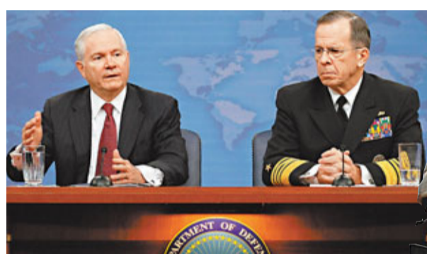
蓋茨(左)強調，消滅780億美元軍費的前提是2014年駐阿富汗美軍人數大幅削減。美軍參謀長聯席會議主席馬倫(右)表示支持方案。

蓋茨說，從2015年開始，陸軍將削減2.7萬名士兵，海軍陸戰隊則削減1.5萬至2萬名士兵，加起來佔現時總數6%，節省60億美元(約466億港元)。但即使在裁軍後，陸軍和海軍陸戰隊人數仍比蓋茨4年多前上任時多。