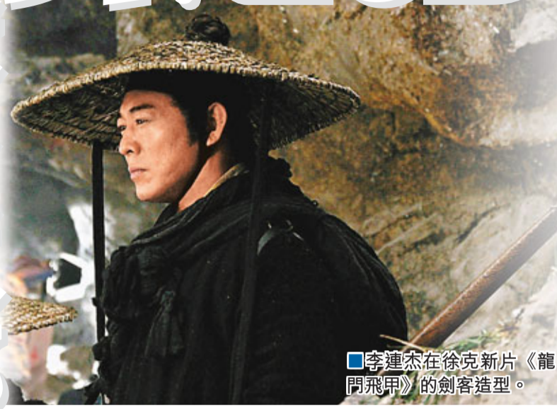
李連杰在徐克新片《龍門飛甲》的劍客造型。

香港文匯報訊 由徐克執導的新概念3D武俠巨製《龍門飛甲》，男主角李連杰的劍客造型公布，他衣着樸素，表情堅毅，身背長劍行走於一片飛沙走石之間。造型經過四度修改，最終呈現的李連杰造型沒有多餘的色彩和裝飾性部件，只保留了最簡便實用的部分，被認為是真正的「極簡主義」。