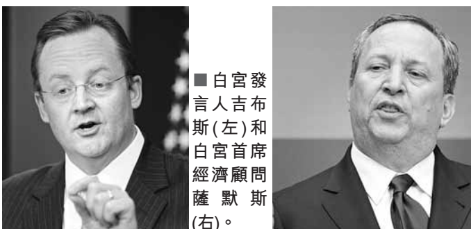
■白宮發言人吉布斯(左)和白宮首席經濟顧問薩默斯(右)。