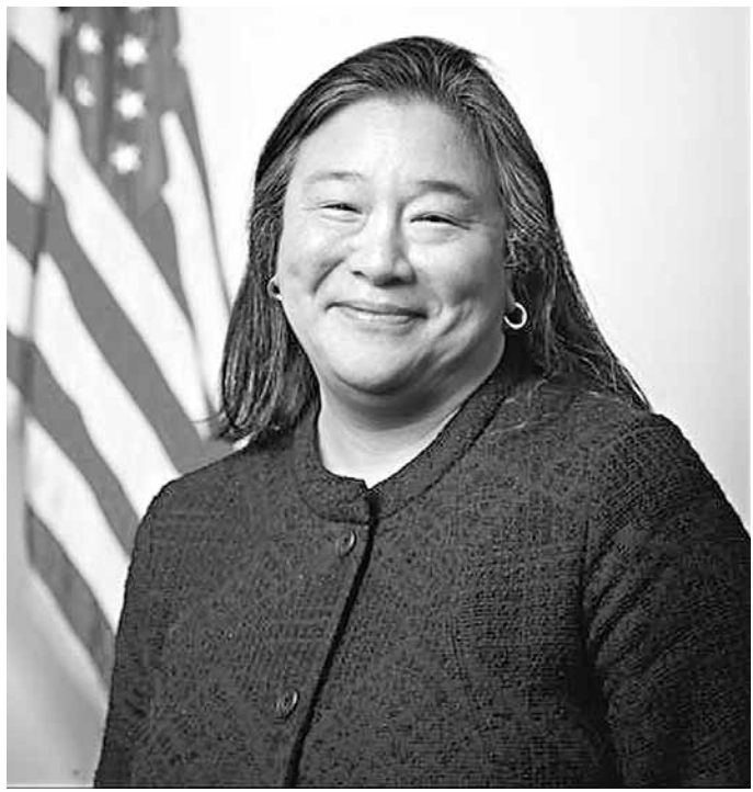
■新任命把陳遠美的總統助理身份「轉正」，令她成為白宮最高官職的華裔。

美國白宮日前發表聲明，宣布將奧巴馬華裔「女軍師」陳遠美(Tina Tchen)擢升為總統助理兼第一夫人辦公廳主任。第一夫人米歇爾與陳遠美相識20多年，她讚揚陳遠美一直不懈地維護婦女和家庭權益，在白宮任職後致力保證全美社團在白宮發聲及擁有影響力，是其辦公廳主任的不二人選。陳遠美現任總統助理兼白宮公共聯絡辦公室主任，新任命將她總統助理的身份「轉正」，令她與現任白宮內閣秘書盧沛寧一樣，成為白宮最高官階的華裔。