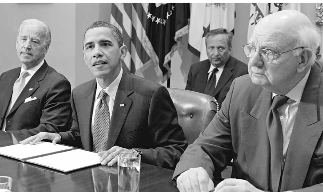
■消息人士稱，若奧巴馬需要，沃爾克(右)會非正式提供意見。圖為去年4月，奧巴馬、沃爾克和副總統拜登(左)在白宮開會。