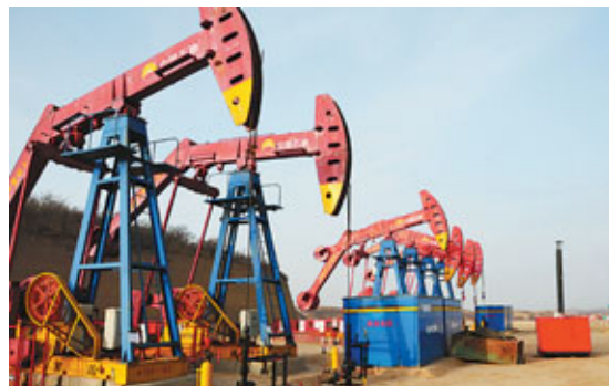
中石油長慶油田。資料圖片

香港文匯報訊(記者 廖毅然) 中石油(0857)昨日在其網站發表報告稱，旗下大慶油田和長慶油田2010年的油氣產量均達到生產目標。當中，大慶油田去年生產原油4,000萬噸，相當於每日803,287桶，與09年的產量持平，為連續27年年產原油5,000萬噸後，第8年實現原油生產4,000萬噸。