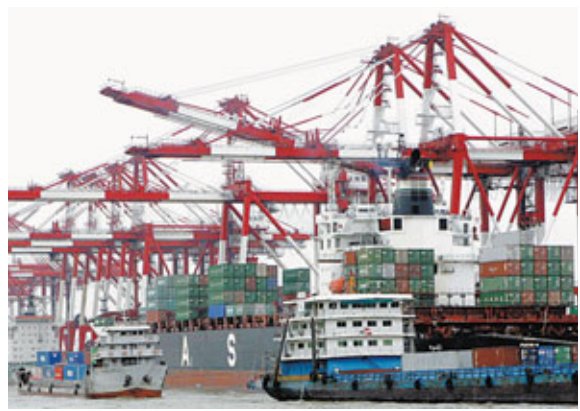
上海外高橋集裝箱碼頭一角。