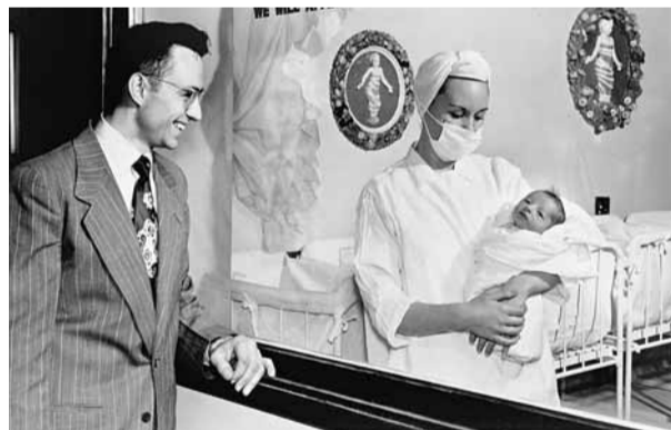
嬰兒潮期間，一名父親探訪孩子。