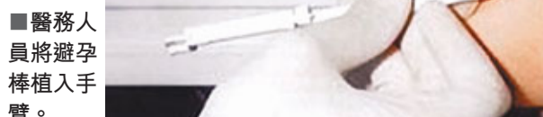
醫務人員將避孕棒植入手臂。

1 Implanon是一枚軟膠管，長4厘米，可植入上臂皮下。 2 植入後，避孕棒釋放人工孕酮，阻止卵巢排卵，可在3年內防止懷孕。 3 有時植入器未能釋放出避孕棒，或因植入位置過深無法正常運作。