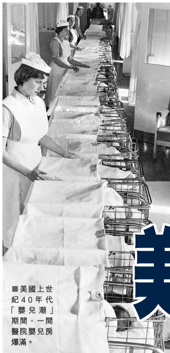
美國上世紀40年代「嬰兒潮」期間，一間醫院嬰兒房爆滿。

對於美國「嬰兒潮一代」而言，今年的元旦是他們人生的一個里程碑。首名嬰兒潮出生者——1946年1月1日生於布法羅的納赫賴納，慶祝了65歲生日，而在今年平均每8秒鐘便有1人跟他一樣，踏入退休年齡。前總審計長沃克形容，「嬰兒潮」的退休將掀起一場「開支海嘯」。據估計，美國醫保計劃已缺資最少23萬億美元(約179萬億港元)，到2017年有可能破產。