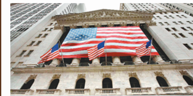
美國經濟仍面臨下行風險，聯儲局同意維持QE2政策。