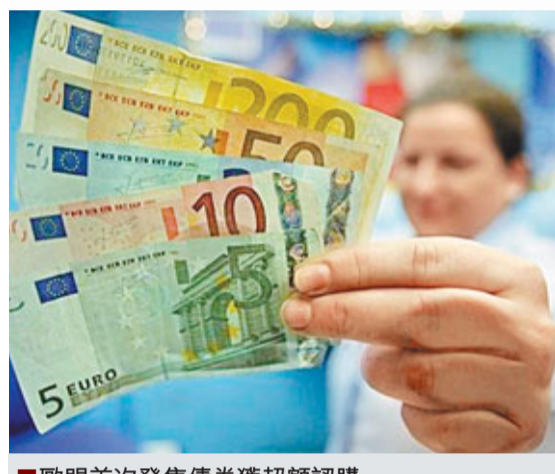
歐盟首次發售債券獲超額認購。

美國民間就業服務機構ADP統計顯示，美國企業上月新增29.7萬職位，創2001年來新高，比分析師預期中位數高2倍。但美元走強拖累商品股價下跌，掩蓋這宗利好消息，美股昨日早段下跌，道瓊斯工業平均指數跌25點，報11,665點；標準普爾500指數跌3點，報1,266點；納斯達克指數跌5點，報2,675點。■法新社/美聯社/新華社