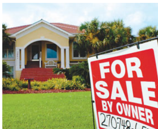
安本資產管理表示,儘管全球物業回報率低於長期平均線,但與其他資產類別相比,其回報依然出色。資料圖片

香港文匯報訊(記者 余美玉)安本資產管理表示,由於未來數月主要經濟體系將維持低息政策,預計投資者將於今年繼續追捧高回報產品;相對於政府債券及現金,股票、公司債券及房地產將更為受惠。而東西方不論在經濟表現還是貨幣政策方面都傾向兩極化,前者會受通脹問題困擾。