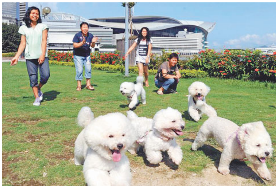
本港不少家庭都有飼養寵物,有主人索性為寵物購買保險,以幫補醫療費用。資料圖片

寵物保險與人類普通保險無異,受很多條款限制及有不受保事項,主人於投保前應多加留意,例如比得鬥牛犬、阿根廷杜格犬、巴西非拉犬及日本佐太犬等競獵犬並不受保,另有指定狗種需繳附額外保費。此外,所有於投保前已有的症狀、日常預防性治療的費用等,都屬於不受保之列。