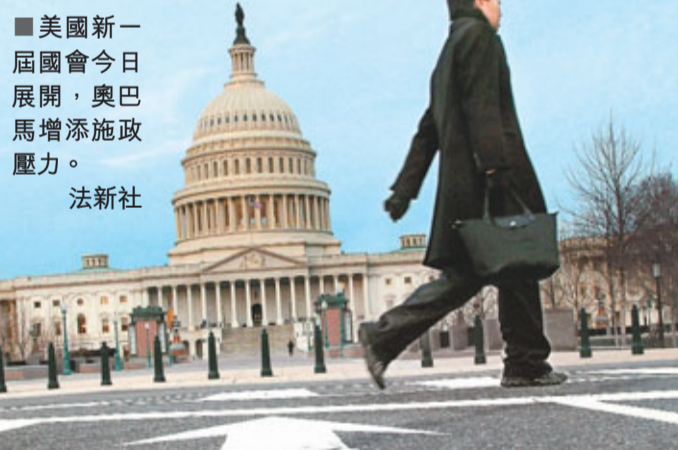
美國新一屆國會今日展開，奧巴馬增添施政壓力。

奧巴馬若要在2012年成功連任，就必須證明他既不是「逃脫專家」亦不是「計算機器」。問題是奧巴馬既失去眾議院控制權，又與民主黨摩擦增加，他或已失去政治方向。