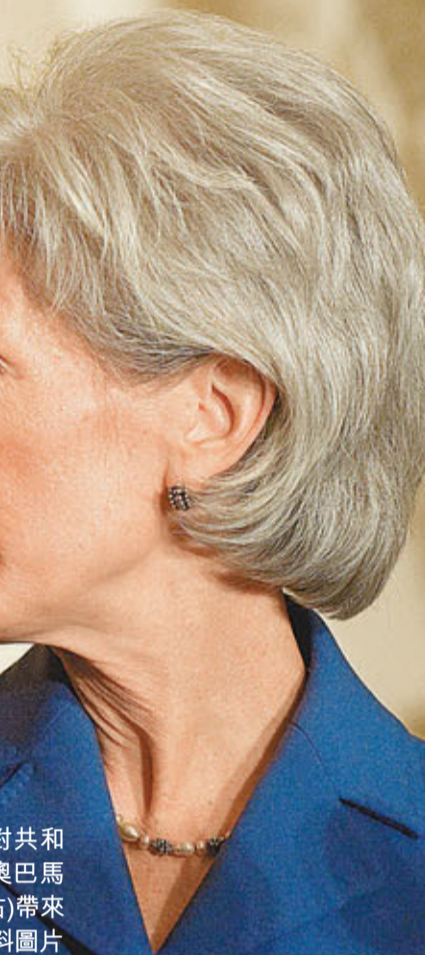
醫療保健改革政策面對共和黨廢除議案，可對總統奧巴馬及衛生部長西貝利厄斯(右)帶來重大打擊。