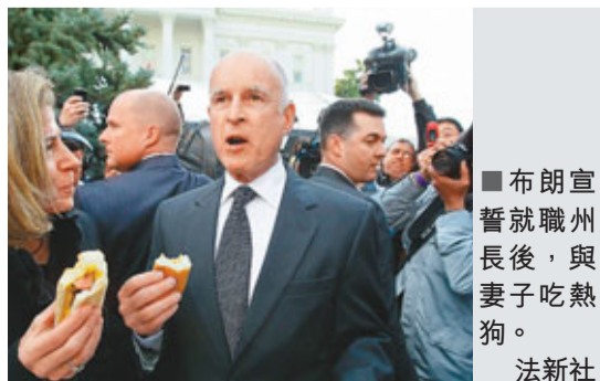
布朗宣誓就職州長後，與妻子吃熱狗。