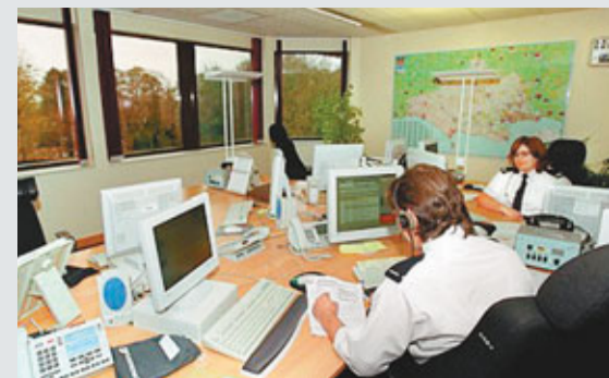
英國警方的報案中心。