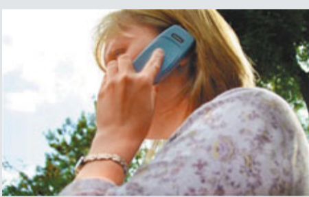
英國報案者私隱被警方秘密儲存。