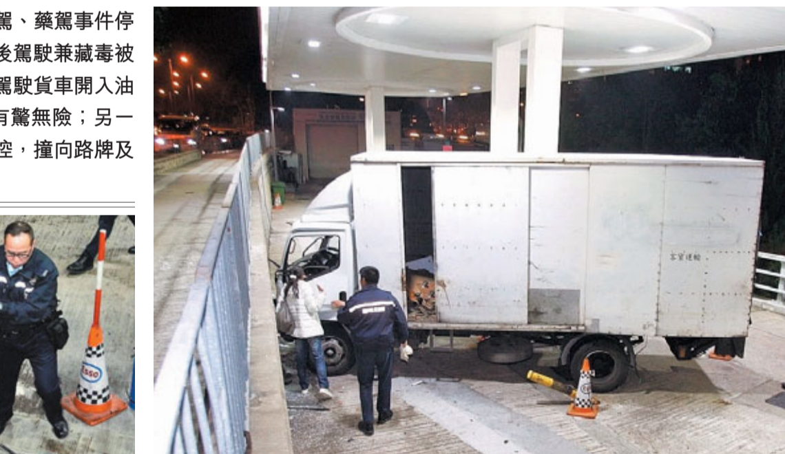
貨車在青衣路油站失事撞牆，險撞及加油機釀成大爆炸。

警員到場時肇事貨車司機已下車，但顯得神志不清，警員發覺他鼻孔沾有白色粉末，懷疑有人藥後駕駛，其後在貨車搜出少量疑是毒品的白色粉末，遂以「在藥物影響下駕駛」及「藏毒」罪名將姓蕭司機拘捕。