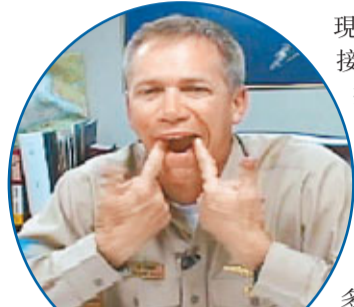
霍諾斯在片中扮鬼臉。

美國海軍在新年伊始爆大醜聞，多段以核動力航空母艦「企業」號艦長霍諾斯為主角的低俗「娛軍」影片，在元旦外洩。這些影片於2006年至2007年間在艦上播放，其中一條片內，霍諾斯以粗言辱罵同性戀者，又模仿自慰動作，甚至闖入浴室拍攝女兵出浴。海軍發言人回應指影片不能接受，已展開調查。