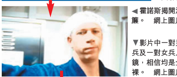
霍諾斯揭開浴室簾。