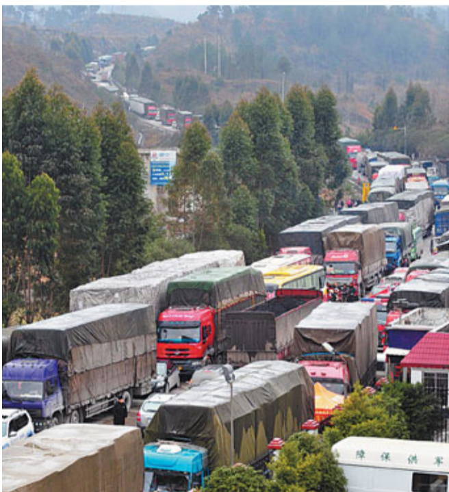
■3日,滯留在廣西南丹段的車輛開始緩慢前移。

另據《法制晚報》報道,昨日上午,記者從貴陽機場集團了解到,貴陽龍洞堡機場已基本恢復通航,目前所有進出貴陽的航班都已正常起降。