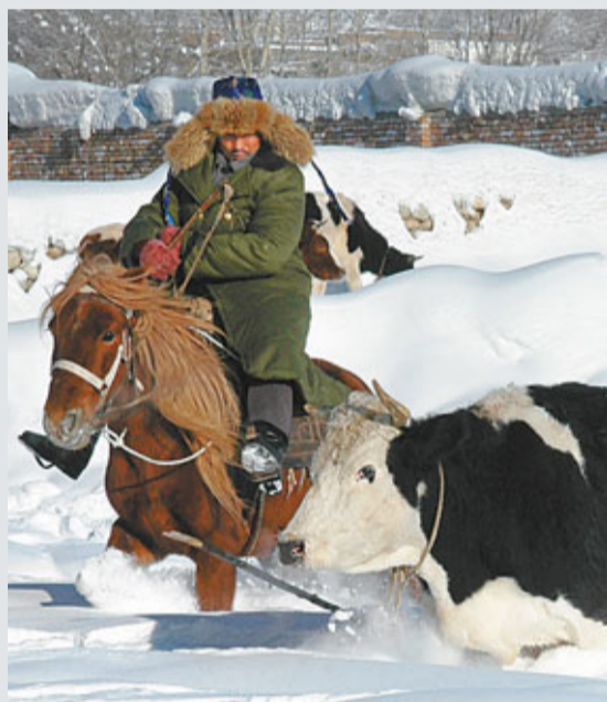
■新疆阿勒泰地區最低溫達到-32℃至-42℃之間。

另據新華社報道,湖南省電力公司宣佈從昨日(3日)起,湖南電網進入雨雪冰凍黃色(III級)預警。據悉,大幅降溫導致全省用電負荷迅速增長,湖南電網最大用電負荷突破1,600萬千瓦,日用電量突破3.2億千瓦時(度),超過去年同期水準。同時,多條線路出現覆冰。目前,湖南省電力部門正積極應對冰雪低溫襲擊,採取多項措施保證電網安全穩定運行和全省電力供應。