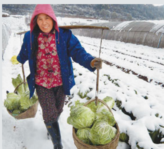
■降雪導致湖北宜昌城大部分蔬菜價格上漲。

國家海洋局北海分局專家提醒,近期受頻繁冷空氣影響,渤海及黃海北部沿岸冰情變化較快,特別是淺海海域的水產養殖區、漁港碼頭、石油平台和有人居住海島等海域可能出現較嚴重冰情。海島居民應提前做好生活、生產等物資準備。