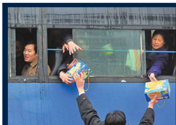
■3日清晨,救援人員給被困旅客發放餅乾。

據悉,目前湖南共有1,100多名路政隊員和2,000多養護隊員日夜奮戰在全省各條高速上,確保惡劣天氣下高速公路的暢通。