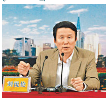
劉悅倫(見小圖)介紹,1985年天河才建區,建區後迎來第一場重要體育盛會——六運會,它給天河帶來的變化就是推動天河北商圍的建立,當中包括

香港文匯報訊(記者 蘭廣凱、古寧 廣州報導)「三次體育盛會造就天河。」天河區委書記劉悅倫日前談及天河發展史時表示,尤其剛結束的廣州亞運,更讓天河經濟得到進一步提升,天河今年的經濟總量預計超過1,800億元,稅收總額預計近300億元,成為廣州經濟總量的第一大區。