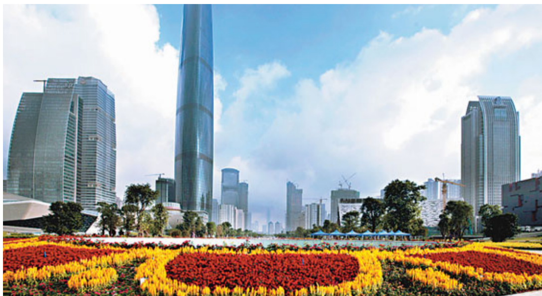
以珠江新城CBD為核心的天河商圍是廣州第一大商圍。

而最重要的標誌性變化就是城市新中軸線的確立,從南邊的廣州塔、海心沙到北面的中信大廈,即珠江新