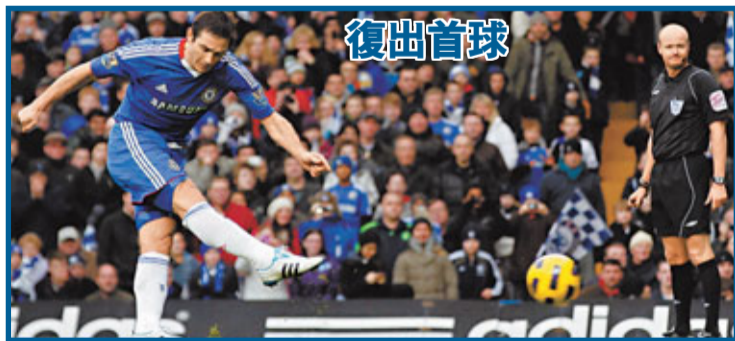
■林柏特23分鐘射入12碼，取得其復出後首個入球，但車路士在主場只能以3:3賽和阿士東維拉。

另外英國媒體表示，卡卡有傳在一月被借到英超曼聯，理由是皇馬主帥摩連好已不再需要卡卡；不過亦有報道稱，曼聯亦有意在今夏收購卡卡。至於馬德里體育會，將會在主場搵桑坦德；馬體會歇冬前4仗各項賽事取得3勝1和；加上在上半季聯賽中，馬體會主場僅得3仗未能取勝，主場失球數只有6個，成為西甲主場失球最少的隊伍之一，其主場威力可見一斑。桑坦德今季表現並沒有明顯起色，目前僅能以5勝3和8負排在積分榜14位，看來球隊依然要為護級好好搶分。 ■梁啟剛