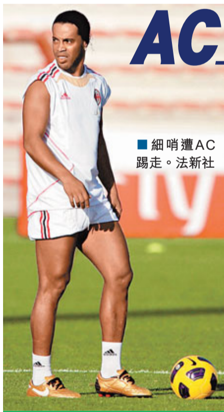
■細哨遭AC踢走。