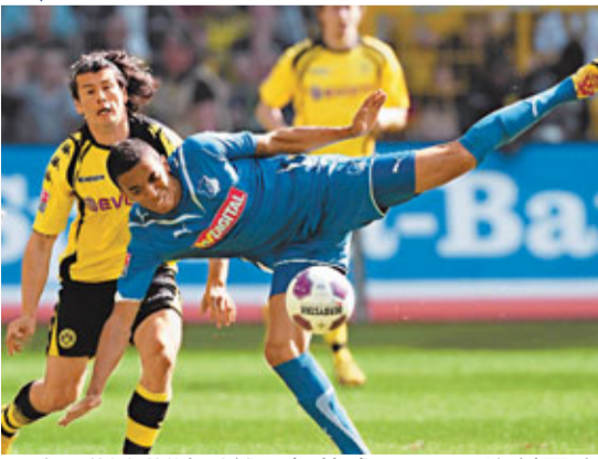
■路爾斯古斯達禾離開賀芬咸。資料圖片

德國拜仁慕尼黑終於完成了他們今冬的第一筆轉會，球會董事會主席路明尼加證實：「我們已經和賀芬咸老闆霍普就路爾斯古斯達禾的轉會事宜達成協定，他將成為拜仁一員。」只是目前還不清楚路爾斯古斯達禾的轉會費；之前有消息稱，巴西人的身價大約在1000萬歐元到1500萬歐之間。同時賀芬咸教頭蘭尼克在執教這支德甲黑馬四年半之後，突然離職；正是路爾斯古斯達禾的轉會，成為引爆他與投資人霍普之間矛盾的導火索。