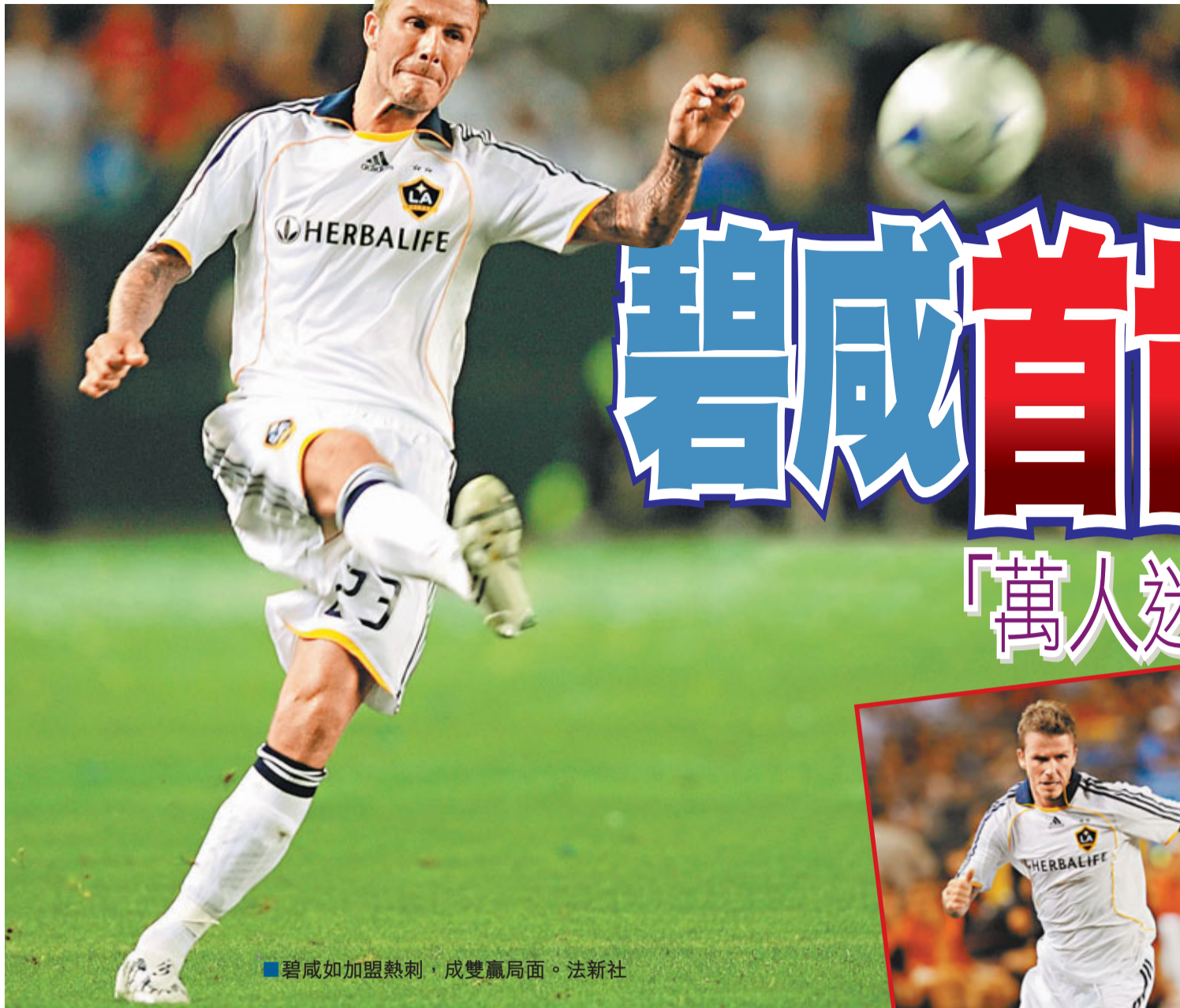
■碧咸如加盟熱刺，成雙贏局面。