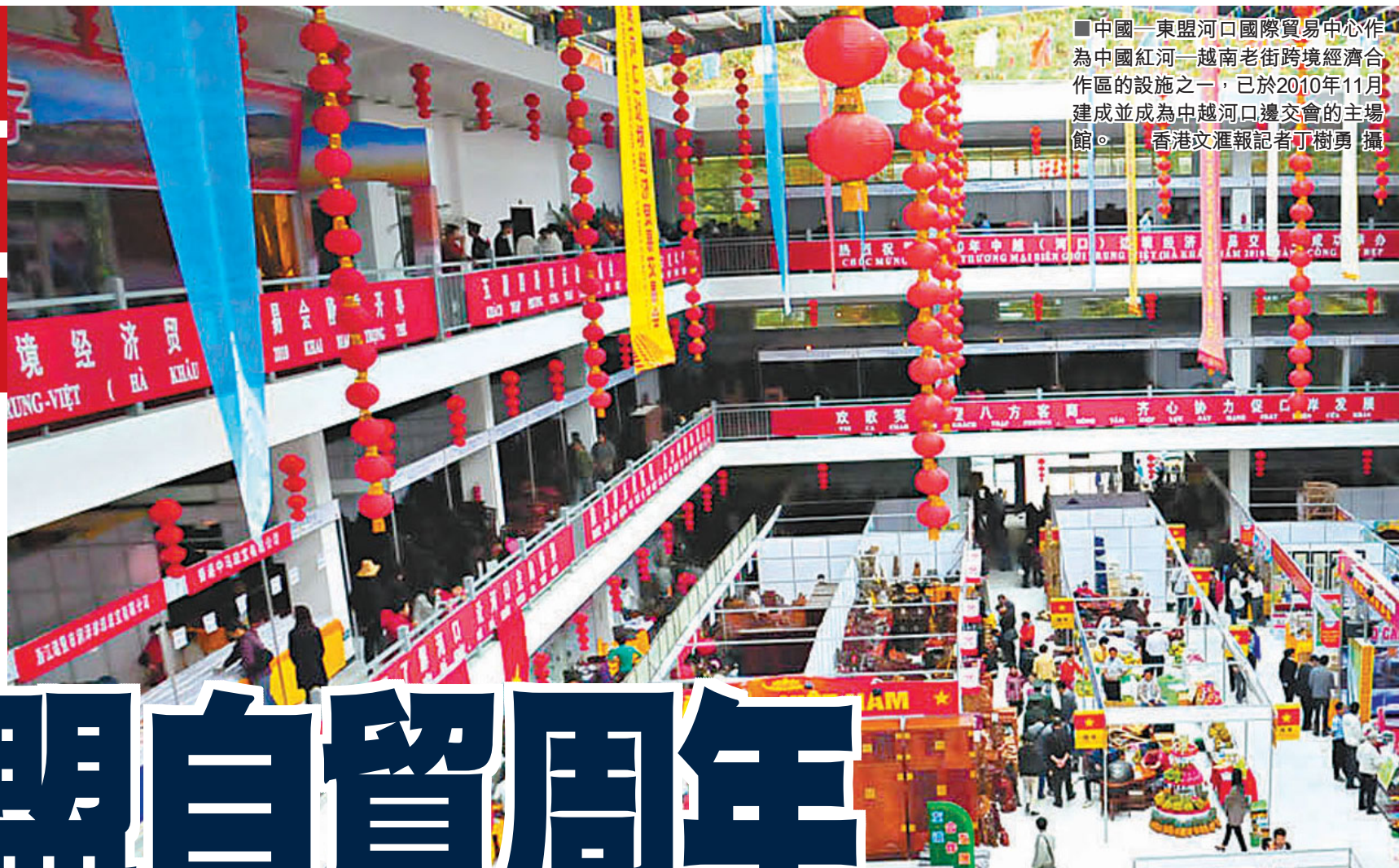
■中國—東盟河口國際貿易中心作為中國紅河—越南老街跨境經濟合作區的設施之一，已於2010年11月建成並成為中越河口邊會的主場館。