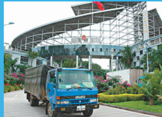
■中老邊境上的磨憨口岸。

中老跨境經濟合作區範圍確定為核心區和支撐區兩部分；中方核心區為國家已批准的磨憨邊境經濟貿易區，周邊支撐區為西雙版納州地域範圍；老方核心區為磨丁黃金城經濟特區，周邊支撐區為南塔省。合作區將依托昆明—新加坡國際大通道和經濟走廊建設，由口岸旅遊貿易服務區、倉儲物流(含鐵路物流區)、保稅區、替代產業加工區和綜合服務區五個部分組成。目前中國磨憨—老撾磨丁跨境經濟合作區合作框架協議已簽訂。