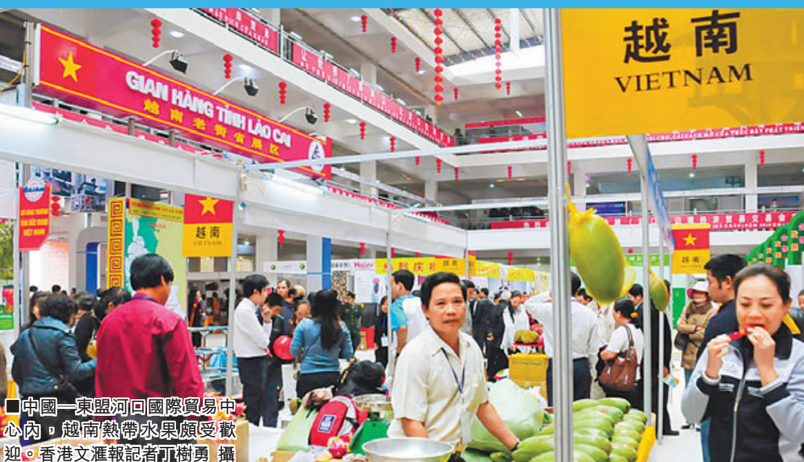
■中國—東盟河口國際貿易中心內，越南熱帶水果頗受歡迎。

率先啟動建設，是目前雲南配套設施最完善、條件最成熟的跨境經濟合作區。佔地130平方公里，由62.5平方公里的越南老街周邊的北沿海出口加工區、東新坡工業區、騰龍工業區和貴沙礫區，以及以金城商貿區為主的紅河口岸區和中方的65平方公里的紅河工業園區和2.85平方公里的河口北山口口岸區共同構建。作為河口北山口口岸區的重要設施，中越紅河公路大橋、口岸聯檢樓已於2009年9月建成試運行，中國—東盟河口國際貿易中心已於2010年11月建成，並成為2010中越(河口)邊會的主場館。目前正在積極推進北山3條主幹道建設、界河河堤政治三期工程、進出口查驗貨場、邊民互市市場、國際物流園區建設。