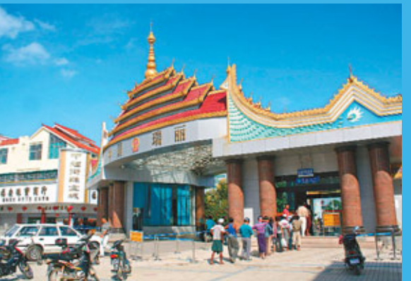
■中緬邊境上的瑞麗口岸。

以昆明—仰光經濟走廊、昆明—南亞經濟走廊和傳統的邊境貿易供貨地及目標市場為經濟腹地，在瑞麗江兩側河谷地帶的600平方公里範圍內，將建集國際經濟貿易、保稅倉儲、進出口加工裝配、國際會展、跨境金融保險服務、跨境旅遊購物、跨境投資和邊境社會發展事務合作的綜合型跨境經濟合作區，兼顧國際物流和旅遊的貿工型自由貿易區。據悉，建設中緬瑞麗—木姐跨境經濟合作區計劃，已正式列入中國商務部與雲南省政府「共同提升雲南沿邊開放水平合作備忘錄」。