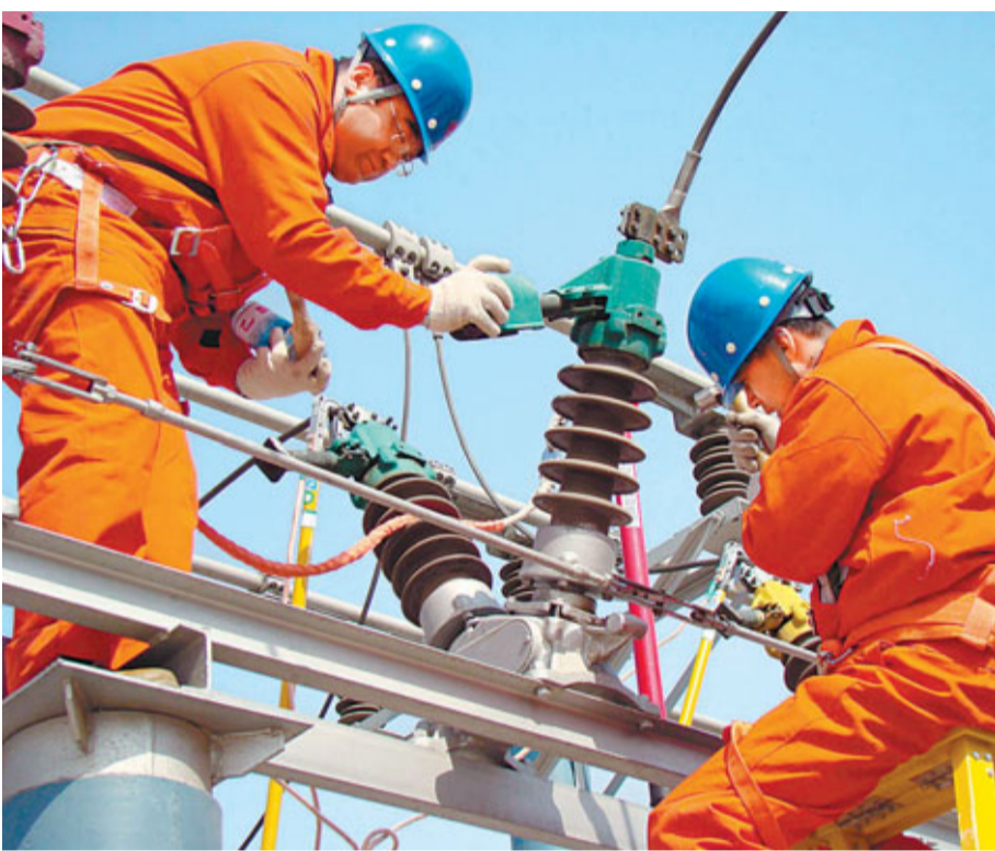
內地建設智能電網將為投資者提供良好的投資機會。

充電站的建設。目前一個充電站投資300萬元左右，一個快速充電樁投資20萬元左右。隨着智能電網業務的建設，預計未來5年全國電動汽車充電站主設備投資可達到150億元。目前香港的上市公司中涉足智能電網業務的較大規模公司不多，投資