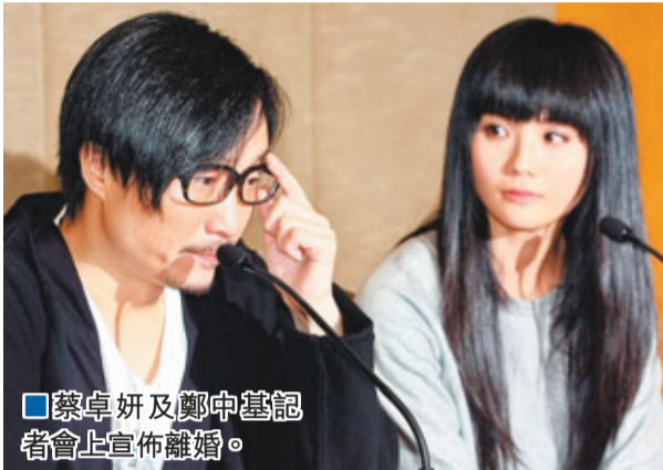
蔡卓妍及鄭中基記者會上宣佈離婚。