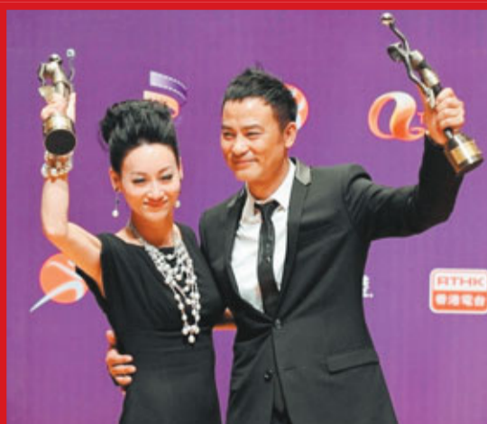
惠英紅(左)和任達華成金像獎影帝影后。