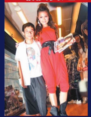
周秀娜的書展簽名會，吸引了13歲學生哥捧場。

近年嘸模冒起，更掀起拍攝性感寫真熱潮，「模界女神」周秀娜大膽推出3D洞房寫真，其他嘸模便以「事業線」迎戰，原本打算算盤在書展推出，最後被評意識不良，內容低俗，被禁在書展宣傳，就算她們以純文字的copybook侵入書展亦告無效，各嘸模唯有出奇謀搞橋宣傳，最「出位」是Debby自製「撕暴片」，簡直教壞細路，一向敢言的黃秋生炮轟嘸模是「群妖亂舞」，做法如同「妖女」，矛頭更直指周秀娜，EQ極高的周秀娜以低調作風處理，實行我有我做，你有你開！