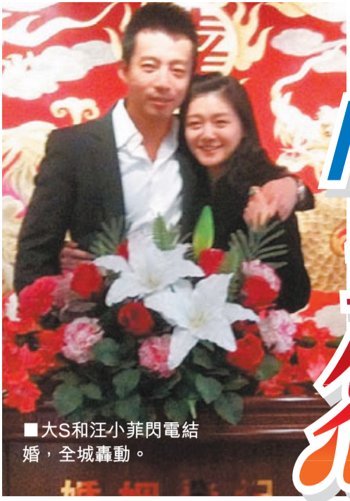
大S和汪小菲閃電結婚，全城轟動。