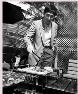
郭位分亨烤肉醃料的「秘技」。

香港文匯報訊 (記者 歐陽子瑩) 香港城市大學近年積極錄取台灣學生，讓學生背景更多元化。為爭取優秀的「尖子」入學，校長郭位於剛過去的聖誕節，就親自出馬率領校內的台灣學生一同前往當地中學宣傳及「揀蟀」，預計錄取約20人。郭位笑指，城大重視吸納台生，甚至引起了台灣「總統」馬英九的注意，對方在網誌「投訴」指，當地「尖子」都被香港院校搶去了。 郭位昨日邀約傳媒燒烤聚會。他透露，自己在剛過去的聖誕節到過當地兩所中學宣傳招生，隨團並有數名分別於前年及去年入讀城大的台灣學生，跟當地中學生分享在香港讀書的體驗。城大於09及10年分別錄取了9名及18名台灣學生，郭位認為台生素質甚佳，預計今年會再錄取約20人。不過，由於招生宣傳行程緊密，郭位難得在佳節回到老家，最終也只能抽空半小時回家探望母親。 對於近年本港院校開始重視台灣生源，陸續到台灣「揀蟀」，郭位笑指連台灣「總統」馬英九也在網誌透露，台灣的「尖子」都被香港院校搶去了。郭位則認為：「香港每年都有近千名學生到台灣升學，為何香港近年才有大學錄取台灣的學生？」他期望透過多錄取台生，加強港台兩地學生的文化及學術交流。郭位一向有「廚神校長」之稱，他特意為昨日的燒烤會花了一天準備食物，在記者面前大顯身手親自烤肉，又以科學理論融入烹煮，與記者分享他炮製色香味俱全的烤肉的「大秘密」。 郭位醃製的雞翼及牛仔骨吃得在場人士津津有味，他笑稱：「知道為何甚麼肉這麼嫩嗎？」當他聽到味精或鬆肉粉等答案時，強調沒有加添任何人造物料，「秘訣在於使用雪梨及啤酒醃製。」他解釋指：「當肉內的二氧化碳遇上火烤時，產生的化學作用便可以令肉質更嫩滑了，因此使用有汽水也可以。」