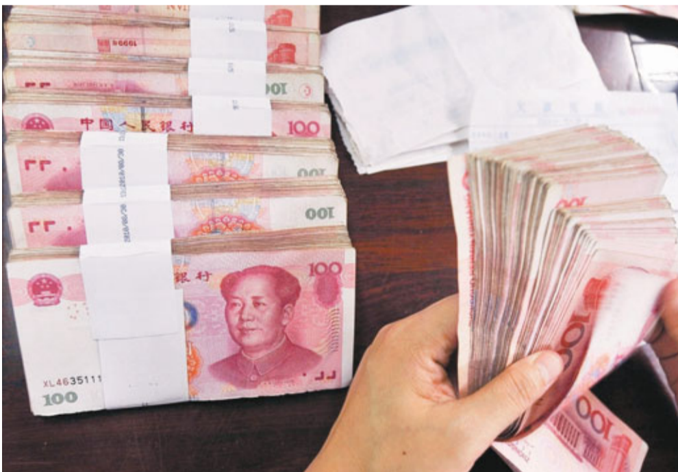
人民幣兌美元中間價連升8日，再創匯改以來新高。