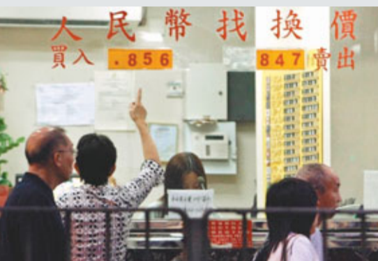
港兌換店的人民幣買賣價，有時同一日早上與黃昏時會有所不同。