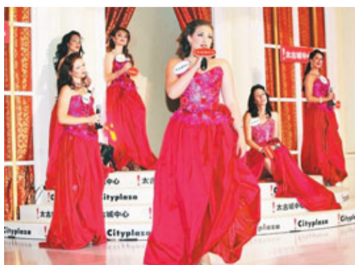
■澳洲七人女子歌劇團VII Sopranos。