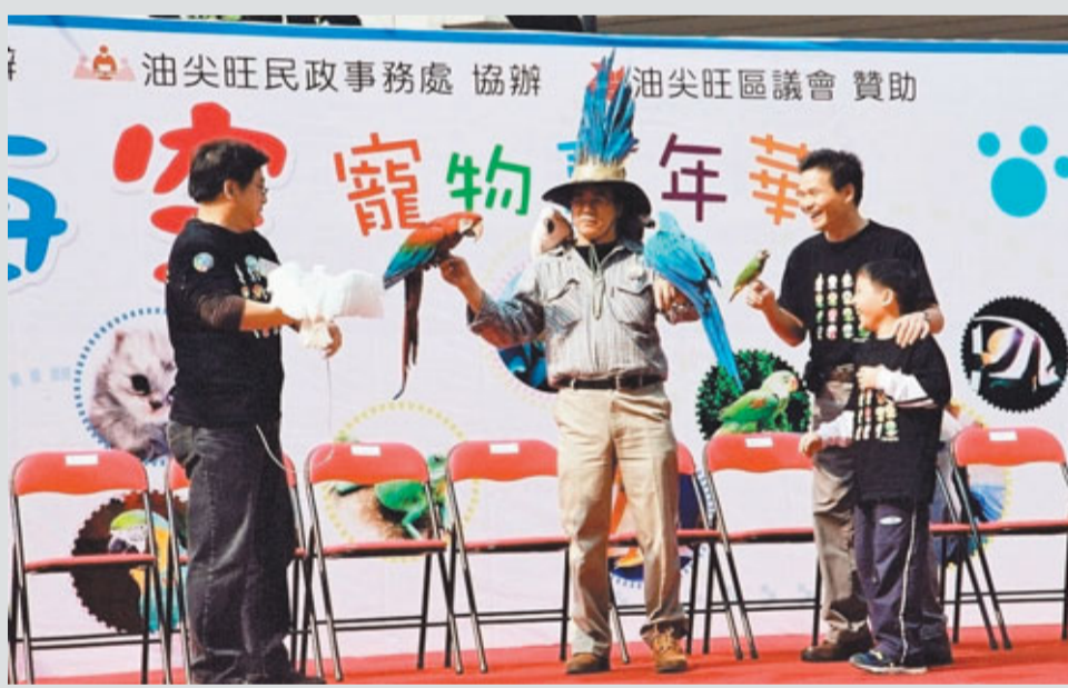
■寵物嘉年華讓你與寵物也能自得其樂。

說的是在今日及明日兩天在界限街1號體育館及花園舉行的「油尖旺區——海陸空寵物嘉年華」，讓你有更多機會與不同的專業寵物團體交流之餘，亦可學習正確照顧寵物的知識。