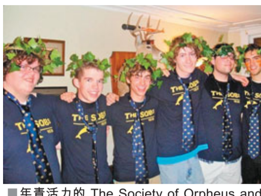
■年青活力的 The Society of Orpheus and Bacchus。