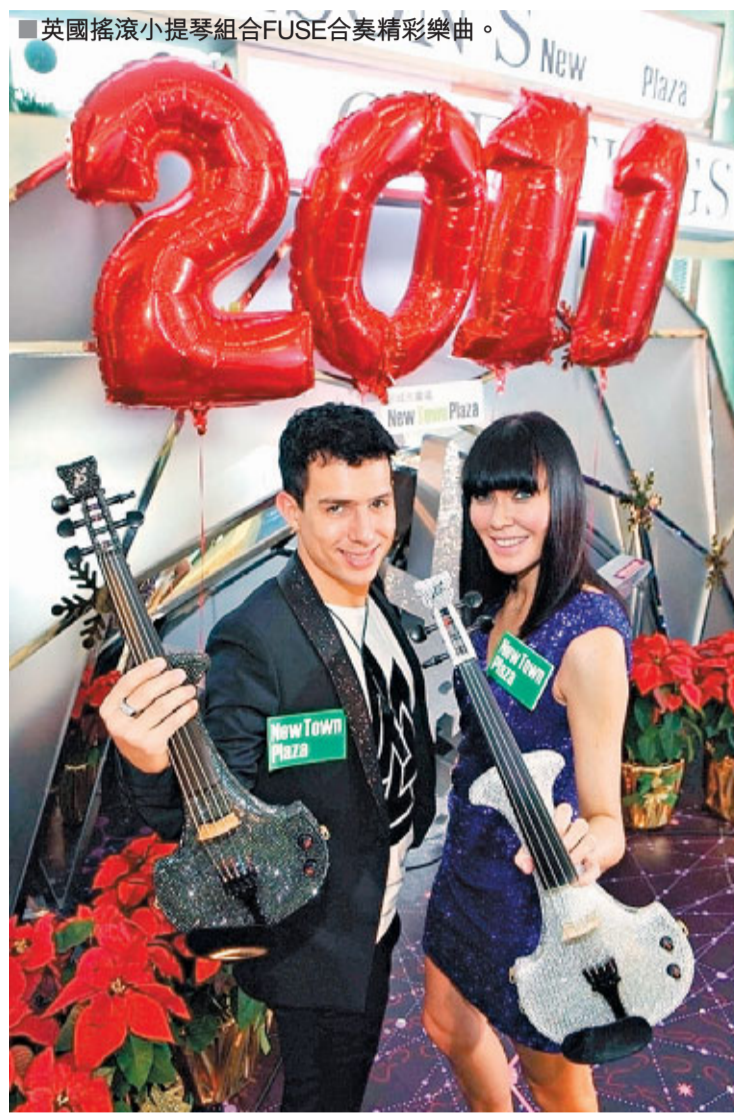
■英國搖滾小提琴組合FUSE合奏精彩樂曲。