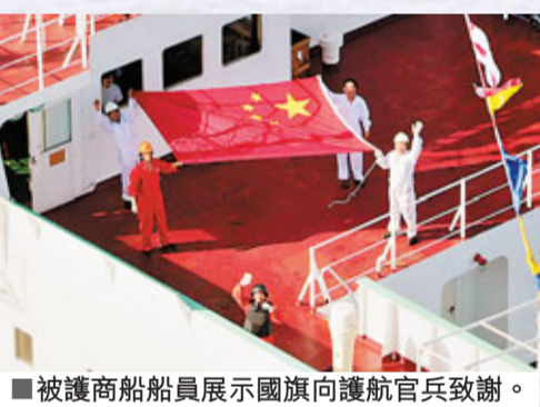
■被護商船船員展示國旗向護航官兵致敬。