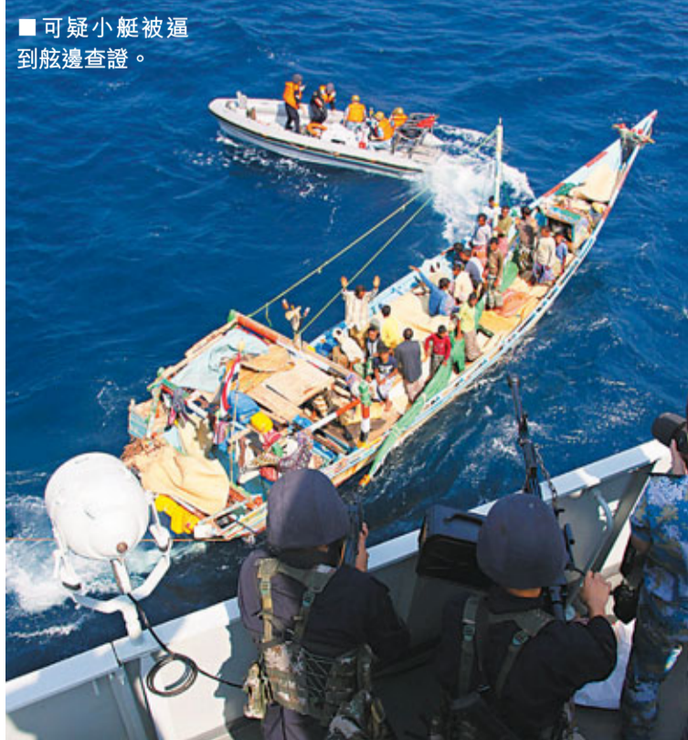
■可疑小艇被逼到舷邊查證。

2009年12月16日，海軍第三批護航編隊返航途中停靠香港。其間，香港海員工會、香港船東會、香港航運界聯誼會等16個航運界團體的代表，專程來到「舟山」艦，向護航編隊官兵贈送了兩面繡着「威武之師、海員護盾」、「仁義之師、護航使者」的錦旗。護航編隊也成了香港的「明星」，市民爭相上艦參觀，一睹護航艦艇和官兵風采。