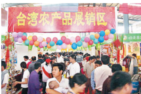
明年1月1日起，將有539項台灣產品可以享受優惠關稅待遇進入大陸市場。圖為台灣農產品在泉州一個展洽會上。

他指出，按照ECFA規定，2011年1月1日起，兩岸雙方將於2011年1月1日起，全面實施貨物貿易與服務貿易早期收穫計劃，屆時將有539項台灣產品可以享受優惠關稅待遇進入大陸市場。同時，繼10月大陸首批實施5個服務貿易部門開放後，又將有專業設計、醫院服務、民用航空維修、銀行、證券、保險6個服務貿易部門對台開放。 他說，「以大陸對台主動降稅的18項農產品為例，2011年絕大部分農產品的稅率將從10%以上直降為5%，廣大的台灣農民兄弟有望直接從中受益。」