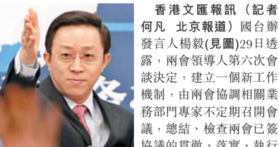
香港文匯報訊 (記者 何凡 北京報導) 國台辦發言人楊毅(見圖)29日透露，兩會領導人第六次會談決定，建立一個新工作機制，由兩會協調相關業務部門專家不定期召開會議，總結、檢查兩會已簽協議的貫徹、落實、執行情況。他說，「我們認為這是一件很有意義的事情，有利於協議發揮更好的效果」。而此機制的具體運作模式，將由兩會進一步協商確定。