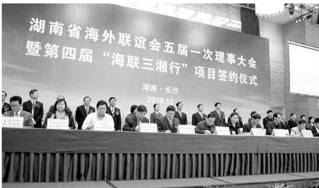
湖南省海外聯誼會五屆一次理事大會暨第四屆「海聯三湘行」項目簽約儀式。

此外，又先後組團80多次赴50多個國家和地區開展多領域交流，邀請海外60多個國家和地區的重要人士和團