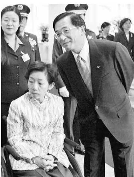
今年來，陳水扁一家的消息頻頻上報，成為台灣網民印象最深刻的新聞。

陳致中成為「胡扯」選項中的指標人物，不是因為跟《壹周刊》打輸嫖妓官司，而是因為他為老爸出氣，包括當選高雄市長議員後，他振振有詞地說「連線36席，為扁出氣」以及「台灣人當『總統』才會被關」，網友認為這些言論是胡扯。