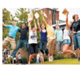
英國大學自設考試篩選優秀學生。

英國明年報讀大學人數可能會出現破紀錄新高，至少有2成大學和高等教育機構為此決定增設自己的入學試，希望從中挑選出素質最優異的學生。專家表示，由於越來越多中學生在高級程度會考中奪A，大學正試圖設法從中選拔新生。最搶手的學院會要求考生參加能力試，而其他院校亦會舉行基本的閱讀能力和算術考試，以確保考生在學位課程開始前正確掌握這些基本功。最新數據顯示，截至上月底有破天荒18萬多名考生完成入學申請，按年升12%，若趨勢持續至明年，可能會有24萬名申請者得不到學位。考生蜂擁入學，與英國2012年大幅提升大學學費有關。