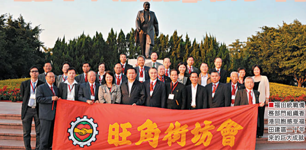
福田統戰僑務部門組織香港同胞感受福田建區三十年的巨大成就。

據介紹，今年以來，福田區僑務部門努力加強深港兩地和對海外的交流聯誼，舉辦了春茗團拜活動、攝影展、慶祝建區二十周年、參觀世博會等活動，得到眾多港澳鄉親、社團的支持。在福田區統戰僑務部門的積極推動下，福田打造「首善之區、幸福福田」的理念得到了港澳同胞、海外僑胞的廣泛認同。