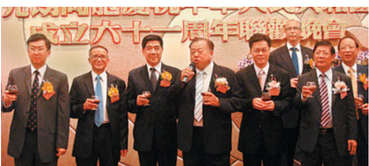
福田僑務部門赴港參加香港社團「國慶」慶祝活動。

同時，福田區僑務部門繼續利用僑務工作的優勢，做好崗廈河圍片區拆遷改造中涉僑、涉港居民的思想工作，向他們宣傳法律、法規和有關政策，化解矛盾，維護他們的合法權益。春節期間，福田區領導、區僑務部門領導深入街道、社區，上門慰問歸僑僑眷病困戶，贈送慰問品和慰問金。同時，選組織各個街道僑聯，對轄區歸僑僑眷病困戶進行了慰問，贏得了僑胞們的高度認可。