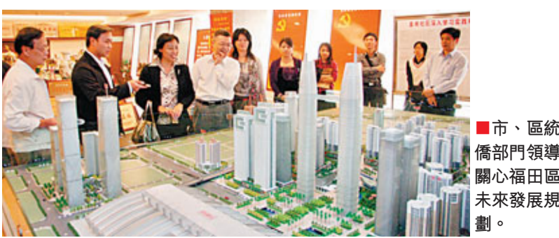
市、區統戰僑務部門領導關心福田區未來發展規劃。